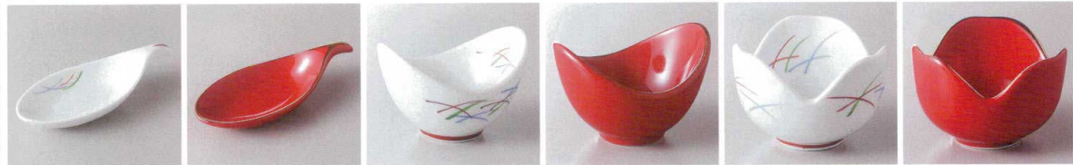
180-19-41J 780円 武蔵野木の葉型珍味 12×4.7×3cm 180-20-41J 720円 赤釉測金木の葉型珍味 12×4.7×3cm 180-21-41J 820円 武蔵野舟形珍味 8.4×6.9×5.2cm 180-22-41J 760円 赤釉測金舟形珍味 8.4×6.9×5.2cm 180-23-41J 780円 武蔵野割山椒珍味 6.4×4.1cm 180-24-41J 720円 赤釉測金割山椒珍味 6.4×4.1cm