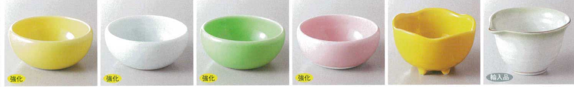
180-25-71J 850円 黄丸千代口 7.3×3.2cm 180-26-71・73J 850円 青白磁丸千代口 7.3×3cm 180-27-71J 850円 グリーン丸千代口 7.3×3.2cm 180-28-73J 850円 ピンク丸珍味 7.3×3.2cm 180-29-33J 700円 黄釉梅型小付 7.7×4.8cm 180-30-8J 750円 ヒロ吹測金片口珍味(大) 8.4×7.6×5.4cm