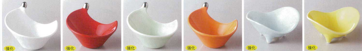
180-7-33J 1,770円 ホワイト壺珍味 7.5×5.7×4.5cm 180-8-33J 1,770円 レッド壺珍味 7.5×5.7×4.5cm 180-9-33J 1,770円 ヒロ壺珍味 7.5×5.7×4.5cm 180-10-33J 1,770円 オレンジ壺珍味 7.5×5.7×4.5cm 180-11-71J 1,050円 青白磁三ツ足珍味 8×7×3.8cm 180-12-73J 1,050円 イエロー三ツ足珍味 8×7×3.8cm