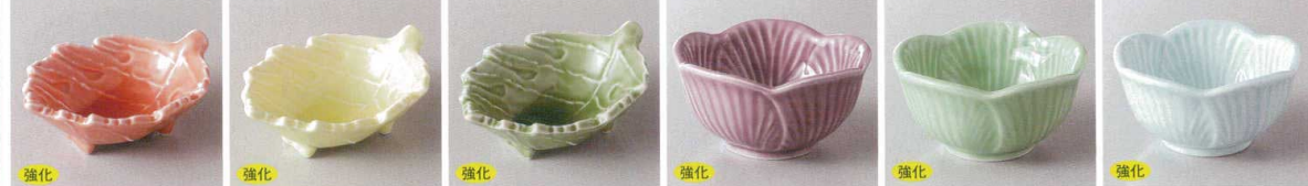
180-31-5J 1,300円 桃釉木の葉珍味 8.7×5.5×3.4cm 180-32-5J 1,300円 黄木の葉珍味 8.7×5.5×3.4cm 180-33-5J 1,200円 天竜青磁木の葉珍味 8.7×5.5×3.4cm 180-34-78J 890円 木の葉型珍味 パープル 6.6×3.5cm 180-35-71J 900円 木の葉型珍味 グリーン 6.6×3.5cm 180-36-79J 890円 木の葉型珍味 ライトブルー 6.6×3.5cm