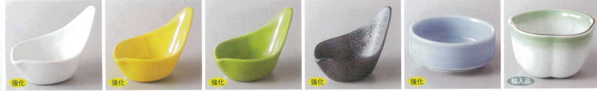
180-37-79J 770円 花びら珍味白 8.6×5.2×5.3cm 180-38-79J 770円 花びら珍味黄 8.6×5.2×5.3cm 180-39-79J 770円 花びら珍味緑 8.6×5.2×5.3cm 180-40-79J 770円 花びら珍味明世黒 8.6×5.2×5.3cm 180-41-48J 1,000円 深海丸千代口 6.5×2.5cm 180-42-8J 800円 ヒロ吹測金梅小付(中) 7.5×7.5×4.5cm