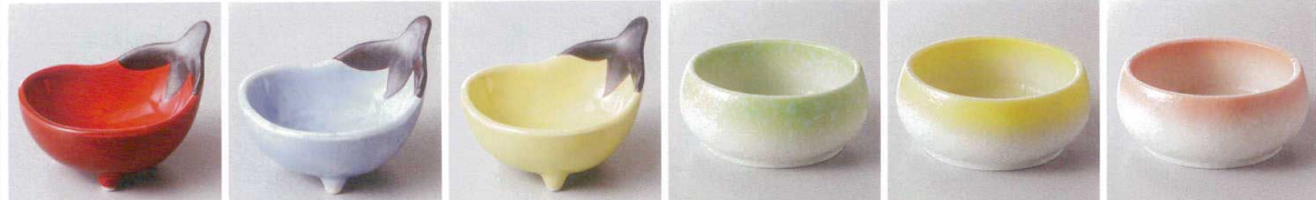
180-13-58J 840円 赤釉ナス型珍味 8.2×6.2×4.8cm 180-14-58J 840円 青釉ナス型珍味 8.2×6.2×4.8cm 180-15-58J 840円 黄釉ナス型珍味 8.2×6.2×4.8cm 180-16-57J 850円 ヒロ吹丸珍味 7.2×3cm 180-17-57J 850円 イエロー吹丸珍味 7.2×3cm 180-18-57J 850円 ピンク吹丸千代口 7.2×3cm