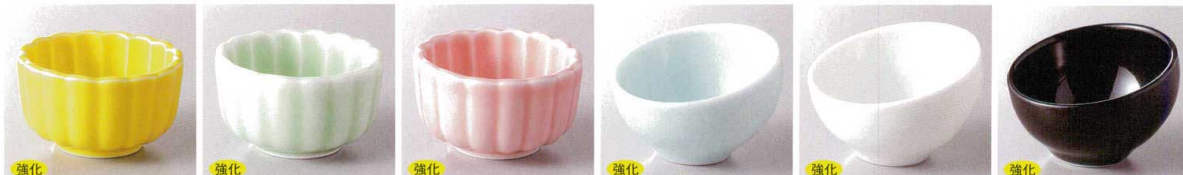
183-1-78J 700円 黄菊花珍味 5×3cm 183-2-71J 700円 ピロ菊花珍味 5×3cm 183-3-79J 700円 ピンク菊花珍味 5×3cm 183-4-71J 600円 青磁丸スラント珍味 6.3×6.3×4.3cm 183-5-71J 600円 ホワイト丸スラント珍味 6.3×6.3×4.3cm 183-6-71J 600円 ブラック丸スラント珍味 6.3×6.3×4.3cm