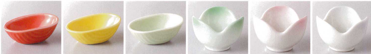
183-31-2J 520円 豆型色珍味(赤) 6×4×2.2cm 183-32-2J 520円 豆型色珍味(黄) 6×4×2.2cm 183-33-2J 520円 豆型色珍味(ヒョ) 6×4×2.2cm 183-34-77J 560円 ヒロ吹三ツ山珍味 5×3.5cm 183-35-77J 560円 赤吹三ツ山珍味 5×3.5cm 183-36-77J 560円 紫吹三ツ山珍味 5×3.5cm