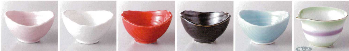
183-25-73J 540円 木目珍味ピンク 5.9×5.6×3.2cm 183-26-71J 500円 白木目珍味 5.9×5.6×3.2cm 183-27-71J 500円 赤木目珍味 5.9×5.6×3.2cm 183-28-71J 500円 黒木目珍味 5.9×5.6×3.2cm 183-29-73J 540円 木目珍味ブルー 5.9×5.6×3.2cm 183-30-21J 460円 二色吹淵金片口珍味(大) 8.3×7.5×5.1cm