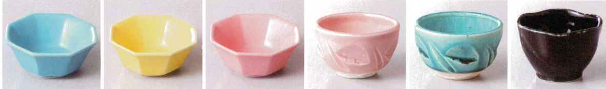
183-7-57J 550円 ブルー八角小付 7×6.8×3cm 183-8-57J 550円 イエロー八角小付 7×6.8×3cm 183-9-57J 550円 ピンク八角小付 7×6.8×3cm 183-10-1J 950円 ピンク削ぎ珍味 40入 6.72×4.1cm 70cc 183-11-1J 950円 トルコ削ぎ珍味 40入 6.72×4.1cm 70cc 183-12-36J 880円 ほたる五ツ山珍味 7×6.7×4.5cm