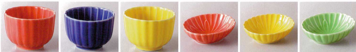
183-37-77J 470円 菊小付・オレンジ 6.3×4.5cm 183-38-77J 470円 菊小付・ルリ 6.3×4.5cm 183-39-77J 470円 菊小付・黄 6.3×4.5cm 183-40-2J 430円 菊型小判珍味ピンク 7.7×6.1×2.6cm 183-41-2J 430円 イエロー小判菊皿 7.5×6×2.5cm 183-42-2J 430円 グリーン小判菊皿 7.5×6×2.5cm