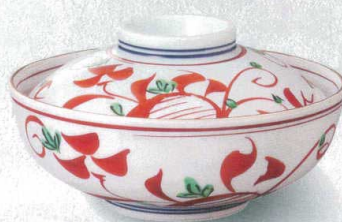
強化 198-2-79J 7,190円 赤絵万層蓋向 16×9.5cm