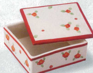
椿 198-7-71J 8,000円 陶箱(大) 15.5×15.5×7cm 198-8-71J 6,000円 陶箱(小) 10.5×10.5×6.5cm