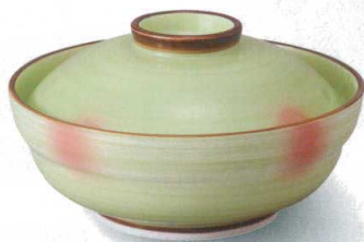
強化 198-1-33J 6,800円 若草吹京蓋物 14.3×8cm