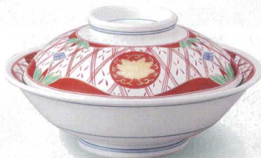
錦華陽紋 198-3-22J 16,000円 8.0骨むし 24.3×12.5cm 198-4-22J 10,000円 7.0骨むし 21.5×10cm