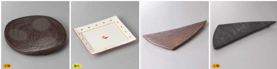
229-9-21J 2,800円 炭化土丸6.0皿 18.5×2.4cm 229-10-22J 2,800円 色絵菱紋角前菜皿 15×18×2.3cm 229-11-1J 2,700円 灰紋陶板長尺一三角皿 35.2×13.2×2.2cm 229-12-1J 2,700円 黒陶板長尺一三角皿 34.6×13.3×2.3cm