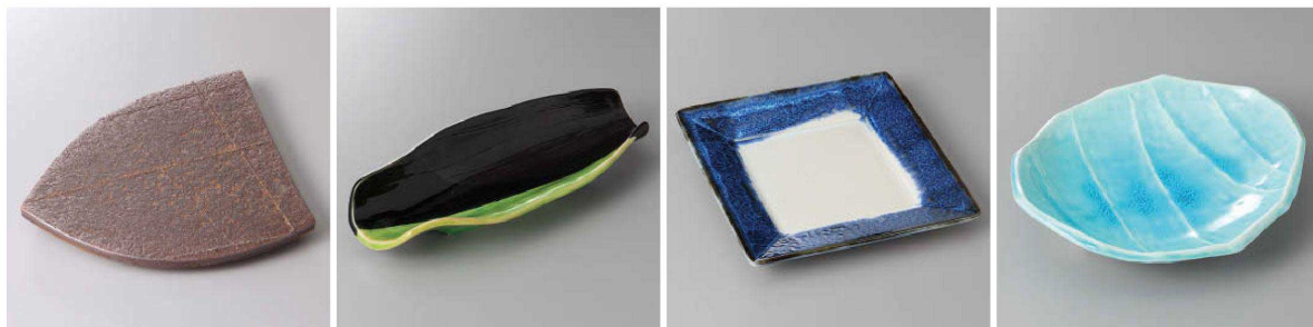
229-13-1J 2,800円 灰紋陶板三つ足三角皿 24×19.5×2.2cm 229-14-56J 2,700円 有明の月葉月(中) 28×11×6cm 229-15-35J 2,700円 しぐなるスクエア16cm角皿 16×16×2.3cm 229-16-22J 2,700円 マリンブルー三つ足前菜皿 23×19.5×5.5cm