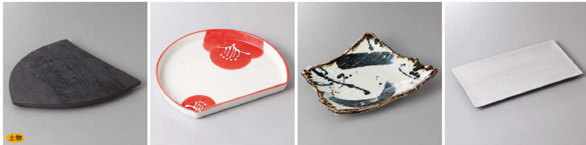
229-5-1J 2,800円 黒陶板石目三つ足三角皿 25.5×22×2cm 229-6-51J 2,800円 染付一珍梅半月皿 19×16.2×2cm 229-7-27J 2,800円 染付ゴスハケ飛し盛皿(小) 24×19×5cm 229-8-22J 2,800円 マット白吹きフラット長角皿 26.7×13.9×1.2cm