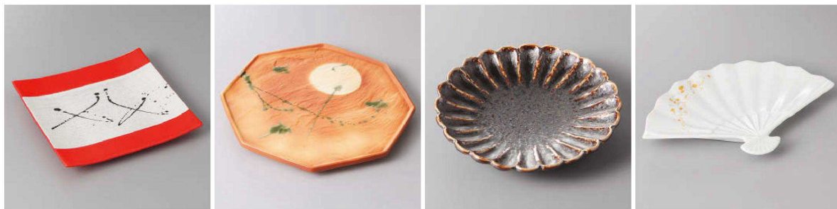
229-1-35J 3,250円 黒飛ばしラスター赤軸筋彫正角皿 18×16.8×2.2cm 229-2-58J 2,900円 焼が満月八角前菜皿 22.2×20.7×1.8cm 229-3-27J 2,900円 孔雀菊彫丸皿 16.8×3cm 229-4-21J 3,100円 金彩扇皿 25.4×6.2×3cm