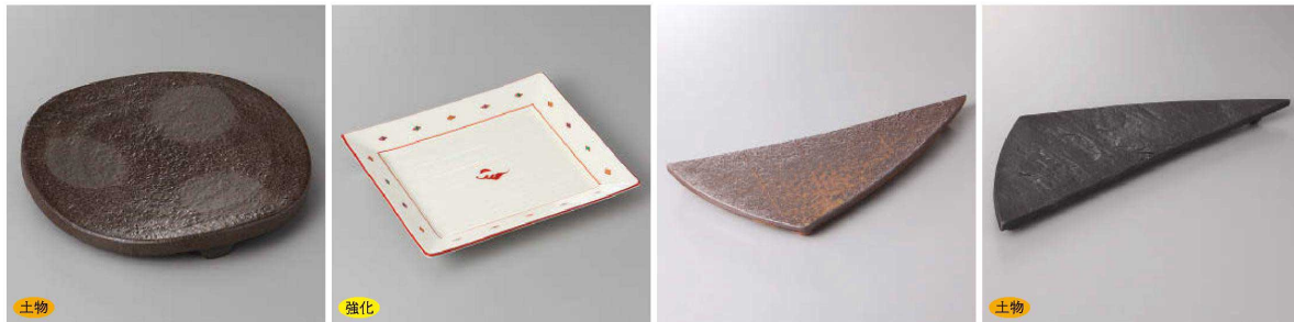
229-9-21J 2,800円 炭化土丸6.0皿 18.5×2.4cm 229-10-22J 2,800円 色絵菱紋角前菜皿 15×18×2.3cm 229-11-1J 2,700円 灰紋陶板長尺一三角皿 35.2×13.2×2.2cm 229-12-1J 2,700円 黒陶板長尺一三角皿 34.6×13.3×2.3cm