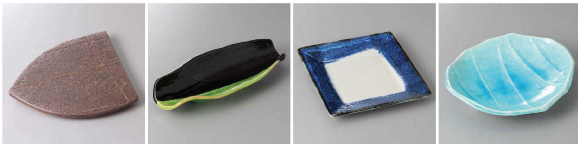
229-13-1J 2,800円 灰紋陶板三つ足三角皿 24×19.5×2.2cm 229-14-56J 2,700円 有明の月葉月(中) 28×11×6cm 229-15-35J 2,700円 しぐなるスクエア16cm角皿 16×16×2.3cm 229-16-22J 2,700円 マリンブルー三つ足前菜皿 23×19.5×5.5cm