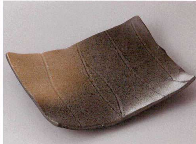
261-5-32J 2,350円 古代釉れいめい四ツ足焼物皿 21.3×16.5×4.2cm