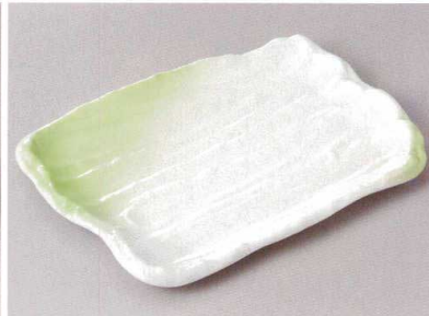
261-6-32J 2,330円 春夏秋冬荒ソギ22cm焼物皿 22×14×2cm