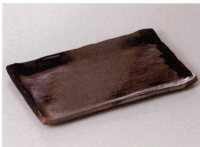
261-11-77J 2,710円 備前灰釉8寸長角皿 23.5×14.5×1.5cm