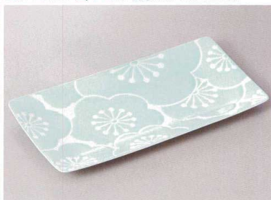
261-17-93J 2,800円 はぶり長角皿(梅・青) 5入 25×13.5×1.5cm 波佐見焼