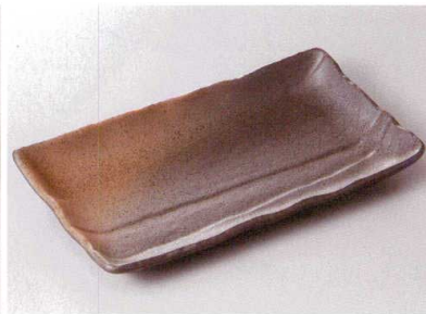
261-10-32J 2,300円 古代釉れいめいソギ焼物皿 24.3×14×3cm