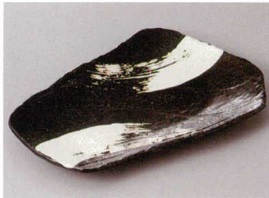
261-7-36J 2,300円 黒炭白刷毛焼物皿 25.5×17.2×3.3cm