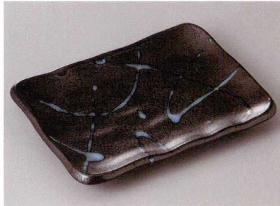
261-4-71J 2,450円 黒潮8.0焼物皿 21×15×3.3cm