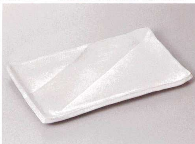
261-12-77J 2,710円 白釉重ね8寸長角皿 23.5×14.5×1.5cm