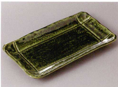
261-15-71J 2,250円 織部そぎ格子8.0焼物皿 25.5×14×2.5cm