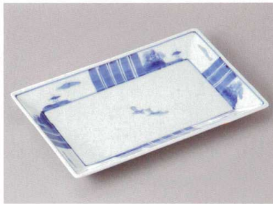
261-1-93J 2,500円 有田焼 十草山水焼物皿 5入 20.5×12.5×2.5cm