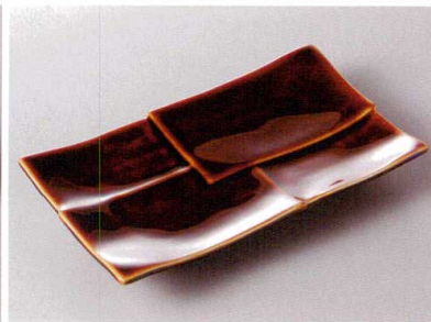
261-3-71J 2,600円 キャラメル市松焼物皿 22.1×13×2.9cm