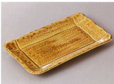
261-16-71J 2,250円 黄瀬戸そぎ格子8.0焼物皿 25.5×14×2.5cm