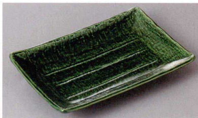
267-11-35J 1,500円 総織部筋入焼物皿 21.5×13.4×3.3cm