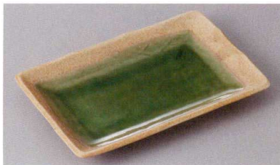
267-10-60J 1,800円 石焼フリット7.0焼物皿 21×12.8cm