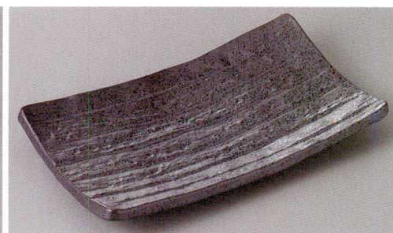
267-9-31J 1,500円 黒結晶足付焼物皿 22×12×3.4cm