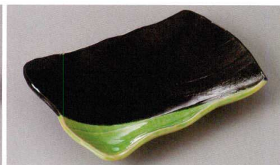
267-6-56J 1,550円 有明の月姿型角皿 19.5×14×3.5cm