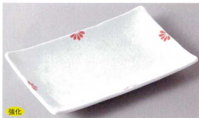
267-7-79J 1,800円 小花(赤)焼物皿 20×13×2.5cm