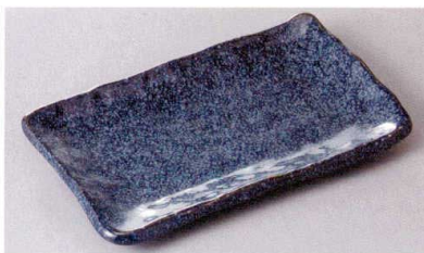
267-14-8J 1,450円 藍四角焼物皿 22×13×2.3cm