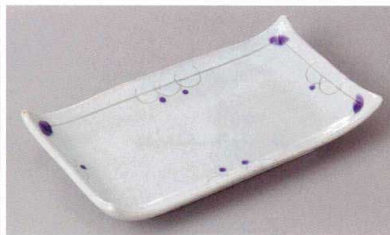
267-2-23J 1,800円 ボルドー焼物皿 21.7×12×3.8cm