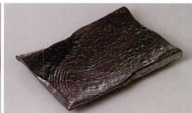
267-12-77J 1,980円 大和玄串皿 17×12×1.8cm