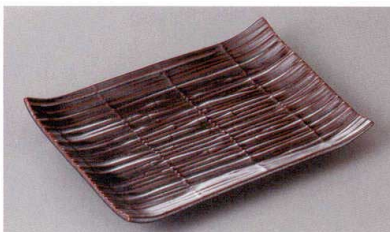
267-17-71J 1,450円 鉄砂スグレ8.0焼物皿(ハマ付) 20.5×14.2×3.2cm