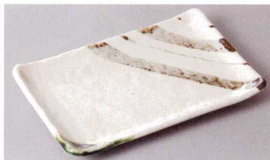
267-5-77J 1,490円 志野錆十草焼物皿 20×13×2.2cm