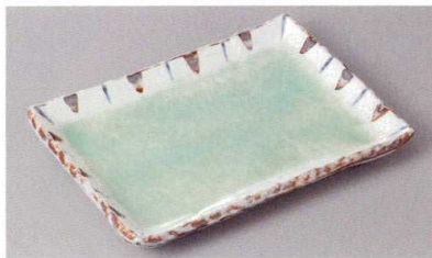
267-1-78J 1,760円 ひわ軸測十草7.0焼物皿 20.8×14.6×2.1cm