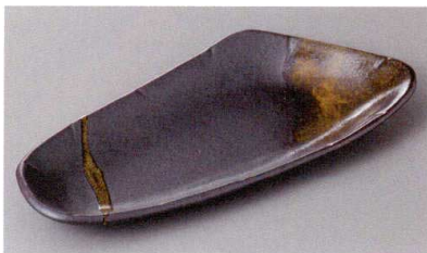
267-13-43J 1,480円 吹き流し三角長皿 27×12.5×2.5cm