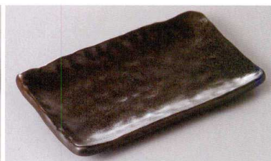
267-15-8J 1,450円 天目四角焼物皿 22×13×2.3cm