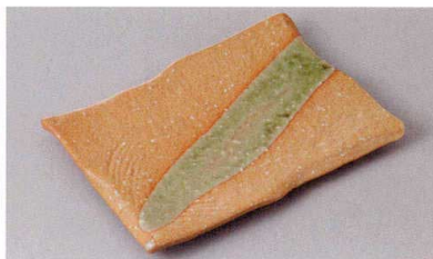
267-8-77J 1,980円 赤志野流し玄串皿 17×12×1.8cm