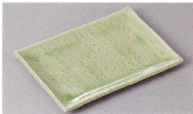
267-4-77J 1,600円 ひわ長角皿 20×13.5×1.5cm