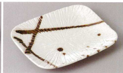
267-3-77J 1,570円 金色流し焼き物皿 20.5×16×2.7cm