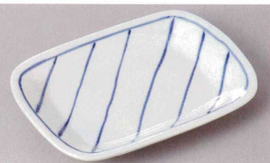
269-17-73J 1,160円 ストライプ小判皿 18.8×12.8×2.2cm