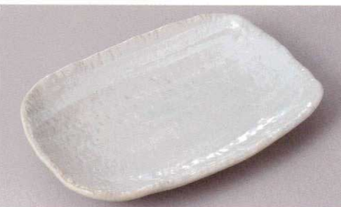
269-8-77J 1,460円 粉引ハケメ小判7.0皿 20×13.5×2.5cm