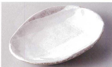
269-9-84J 1,350円 白刷毛目6.5号小判皿 19.5×14×4cm