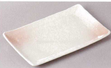
269-2-48J 1,300円 桜吹焼物皿 24×14.5×2.5cm