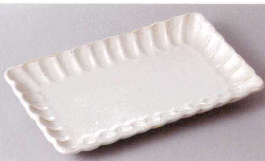
269-5-26J 1,250円 菊華白焼物皿 50入 21×13×2.5cm