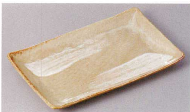
269-12-71J 1,200円 黄灰釉8.0焼物皿 23.6×14.2×2.3cm