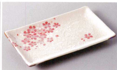
269-3-10J 1,680円 平安桜焼物皿 22×12.5×2.5cm