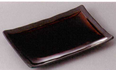
269-11-71J 1,200円 アメ釉7.0長角皿 20.5×13×2.6cm