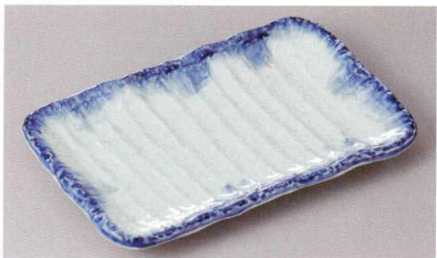
269-13-22J 1,200円 呉須刷毛焼物皿 21.5×13.5cm