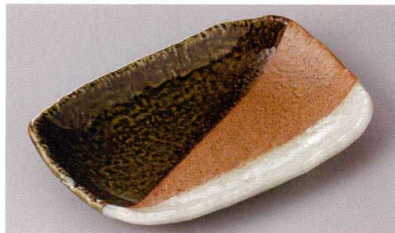
269-7-77J 1,460円 三色塗り分け7寸長角皿 20×13.3×2.8cm