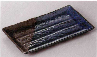
269-16-26J 1,200円 青釉塗り分焼物皿 21×11.5×2cm