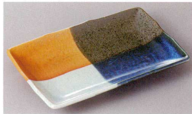
269-1-60J 1,800円 モザイク7.0焼物皿 21×13×3cm