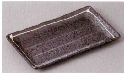
269-4-43J 1,260円 一珍黒結晶焼物皿 20.8×11.4×1.8cm