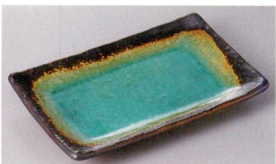
269-15-26J 1,200円 新海焼物皿 21.3×14.2×3cm