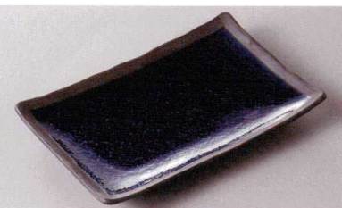
269-14-71J 1,200円 紺結晶7.0長角皿 20.5×13×2.6cm