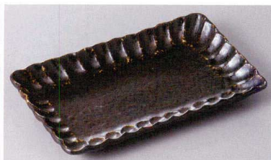
269-6-26J 1,250円 菊華黒焼物皿 50入 21×13×2.5cm