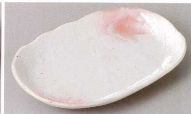
271-3-60J 780円 桜志野小判皿 21×13.5×2.5cm