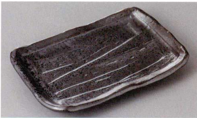
271-11-43J 710円 黒結晶ソギ型焼物皿 20.9×13×2.9cm