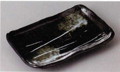
271-14-23J 900円 ソギ型焼物皿黒 21×13×3cm