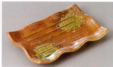
271-9-23J 900円 波型伊賀オリーブ焼物皿 21×13×3cm