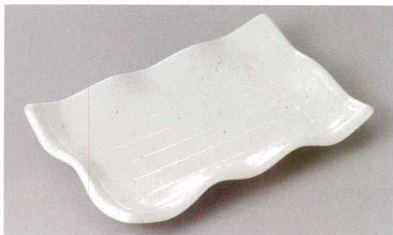
271-15-43J 710円 波型粉引斑点焼物皿 20.7×13×3cm