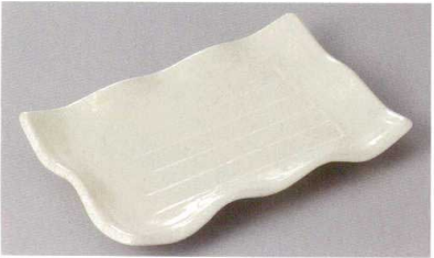
271-16-43J 720円 粉引波焼物皿 21×13×3cm