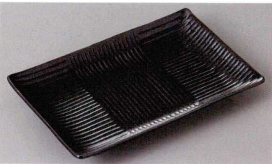
271-17-78J 750円 欄目格子 黒釉焼物皿 21×13×2.8cm