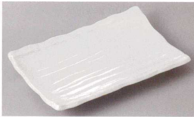
271-5-43J 760円 粉引木目焼物皿 20.7×13×3cm