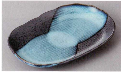
271-4-60J 780円 清流小判皿 20.8×13.5×3cm