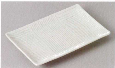
271-18-78J 750円 欄目格子 白釉焼物皿 21×13×2.8cm