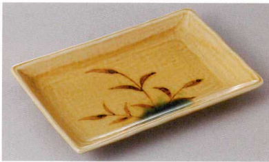
271-8-23J 900円 黄瀬戸芦長角7.5皿 21.3×13.5cm