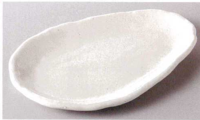
271-2-71J 950円 白粉引|変形楕円皿 21.3×13.9×2cm