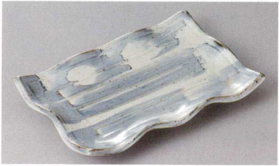
271-13-23J 900円 藍染波形焼物皿 20.5×13×3cm