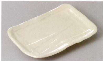
271-12-43J 710円 新粉引ソギ型焼物皿 20.9×13×2.9cm