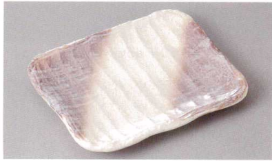
271-7-84J 750円 かすみ志野5号長角皿 16.5×13×2.2cm