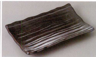
271-6-43J 760円 いぶし天目焼物皿 20.7×13×3cm