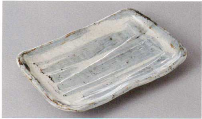
271-10-23J 900円 藍染ソギ焼物皿 21×13×2.8cm