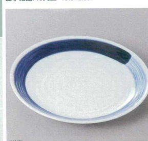
354-17-6J 1,600円 19cm丸皿 19×2.5cm