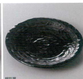
354-24-33J 1,300円 石目6.0皿 20×2.5cm