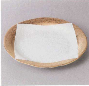
354-2-77J 3,250円 ゴールドスクエアつぼ付6.5寸皿 19.3×2.3cm