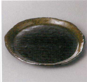
354-12-71J 1,950円 金彩天目モダン皿 21×2cm