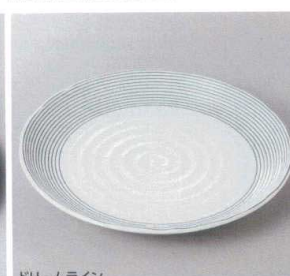
354-22-48J 1,500円 白8.0皿 24×3cm