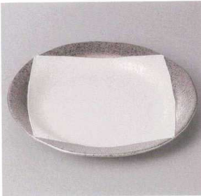
354-1-77J 3,250円 プラチナスクエアつぼ付6.5寸皿 19.3×2.3cm

刺身・肉付 中鉢・小鉢・組小鉢 小付・珍味 松花堂・蓋向・円菓子碗・小吸碗 むし碗・土瓶むし 前菜皿 付出皿・焼物皿 天皿・香水 組皿・和皿 盛皿・オードブル 大鉢・盛鉢・組鉢 組井・ボール 酒器・香置き・卓上小物 箸スプレンゲ・灰皿