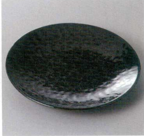
354-8-31J 2,000円 黒銀彩6.0皿 19×2.6cm