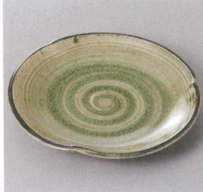
354-7-71J 2,100円 灰釉6.0丸皿 18.6×3.3cm