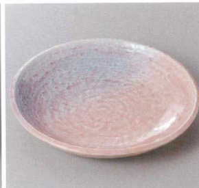
354-10-71J 2,000円 紅釉7.0皿 20.5×3cm