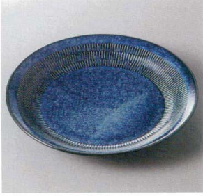
354-4-57J 1,100円 窯変紺トチリ24cmプレート 23.8×3.5cm