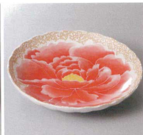
354-16-30J 1,100円 桃山牡丹 紅菊型8.0皿 30入 23×4cm