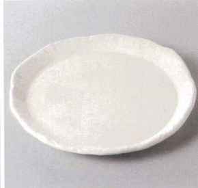
354-6-71J 1,700円 白粉引モダン皿 21×2cm