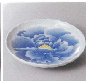
354-15-30J 1,100円 桃山牡丹 藍菊型8.0皿 30入 23×4cm