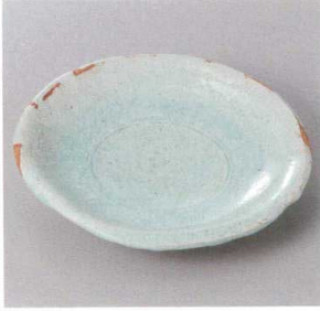
354-3-71J 2,200円 伊賀青磁5.5皿 18.2×3.3cm