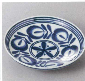
354-9-93J 1,800円 有田焼 モダンブループレート(L) 5入 19.5×4cm