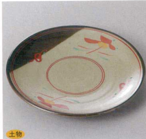
354-5-1J 2,000円 花唐津丸6.0皿 19.5×2.7cm