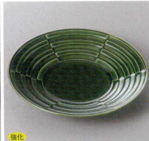
354-11-5J 1,700円 緑釉段付丸皿 18.5×3.3cm