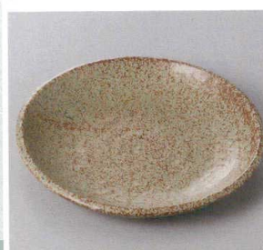
354-13-71J 1,800円 益子結晶7.0丸皿 19.8×2.8cm