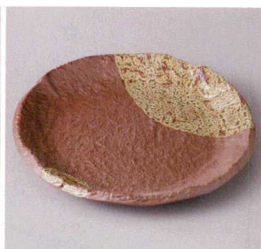
355-3-71J 1,800円 南蛮6.0丸皿 18.5×2cm