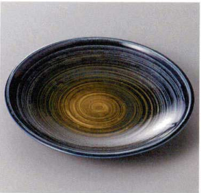
355-19-77J 900円 青嵐丸6寸皿 19.5×19.5×3cm