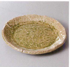
355-21-77J 1,980円 灰袖手彫り芦6.0皿 6.5×3cm