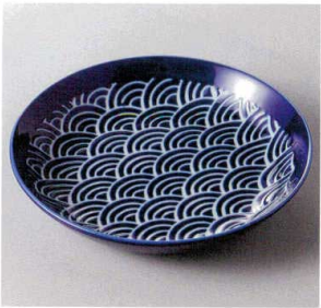
355-14-57J 1,100円 瑠璃なみ深口6.0皿 19.5×4cm