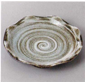
355-10-60J 1,300円 うず潮花型6.0皿 19×3cm