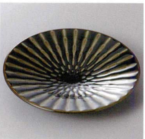
355-16-21J 900円 フォーカス 織部輪二重6.5皿 19.5×2.8cm