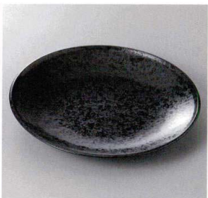
355-11-43J 1,100円 銀彩天目6.0皿 19.3×3cm