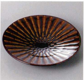
355-15-21J 900円 フォーカス アメ輪二重6.5皿 19.5×2.8cm