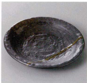
355-7-31J 1,150円 南蛮吹流し石目6.0皿 19.8×2.8cm