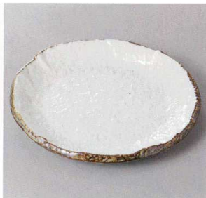
355-6-71J 1,700円 ソバ志野6.0丸皿 18×2.2cm