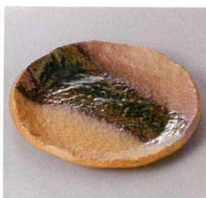
355-4-71J 1,800円 星雲伊賀6.0丸皿 18.6×2.2cm