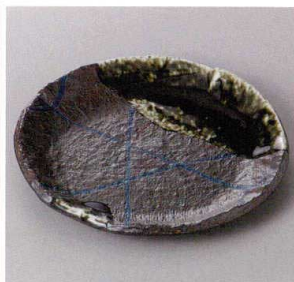
355-2-71J 1,800円 南蛮乱十草6.0丸皿 18.3×2.2cm