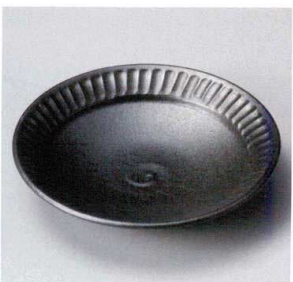
355-12-35J 3,000円 削ぎ目黒6.3深皿 φ18.9×H4cm