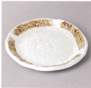
355-5-79J 1,350円 粉引茶刷毛目6.0丸皿 18.3×2.2cm