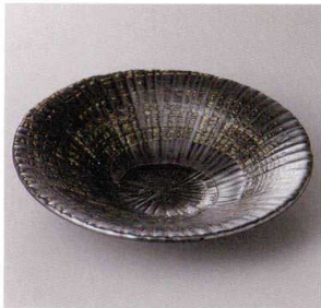
355-9-57J 1,280円 黒渦彫十草型平鉢 19.8×4.3cm