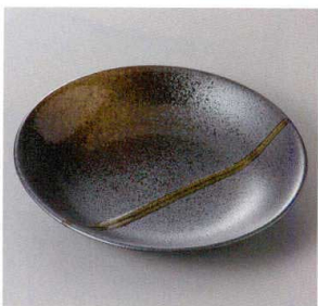
355-8-31J 1,300円 南蛮吹流し6.0皿 20.2×3.7cm