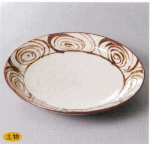
355-20-77J 2,200円 馬の目6寸丸皿 17.5×3cm