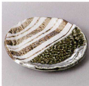
355-1-71J 1,800円 織部ストライプ6.0丸皿 18.3×2.3cm