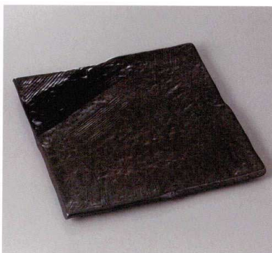
369-5-77J 6,050円 大和新玄24正角皿 24.5×2cm