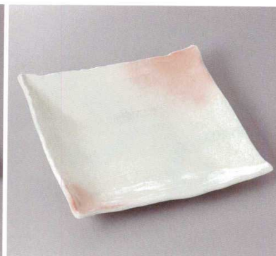
369-3-43J 5,500円 弥生くしめ角大皿 25×25×3cm