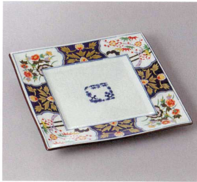
369-1-93J 5,500円 有田焼 染錦紋様8号角皿 5A 23.5×23.5×2.5cm