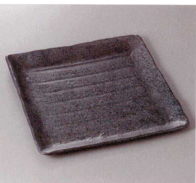
369-12-56J 3,750円 いぶし10.0正角皿 31×31cm