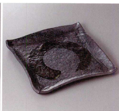
369-6-24J 5,000円 黒結晶四角大皿 27.5×27.5×2.5cm