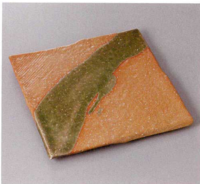
369-4-77J 6,330円 赤志野流し新玄24正角皿 24.5×2cm