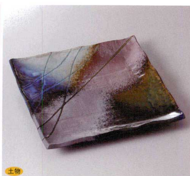
369-9-58J 4,400円 炭火土角7.5皿(605016) 21.5×20.5×2cm