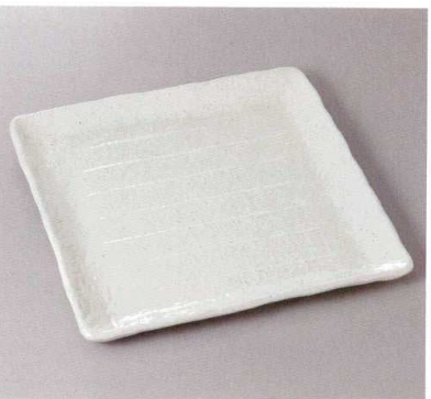
369-11-56J 3,750円 粉引10.0正角皿 31×31cm