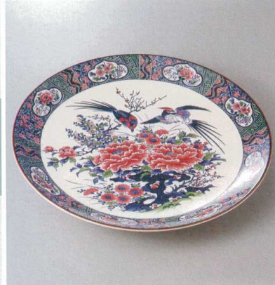
398-18-84J 10,500円 春日13号丸皿 42.5×5cm