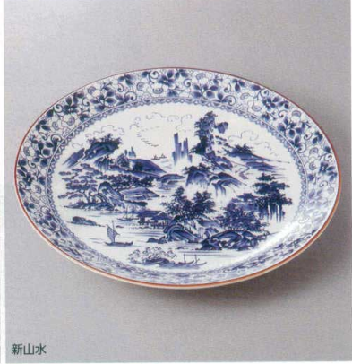
新山水 398-20-84J 8,700円 13号丸皿 42.5×5cm 398-21-84J 5,300円 12号丸皿 37×4.5cm 398-22-84J 3,300円 10号丸皿 32×3.5cm