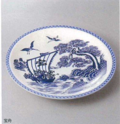
宝舟 398-13-84J 5,300円 12号丸皿 37×4cm 398-14-84J 3,300円 10号丸皿 32×3.5cm