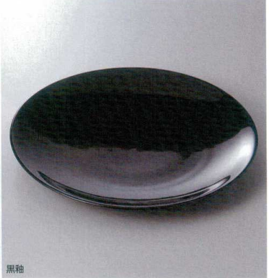
黒釉 398-15-84J 9,300円 13号丸皿 42×5cm 398-16-84J 5,300円 12号丸皿 37×4.5cm 398-17-84J 3,800円 10号丸皿 32×3.5cm