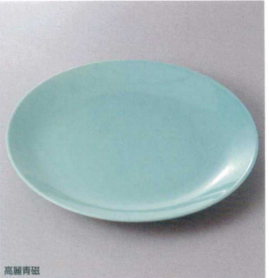
高麗青磁 398-6-82J 7,200円 13号丸皿 41×5cm 398-7-82J 4,200円 12号丸皿 37×4.5cm 398-8-82J 3,800円 11号丸皿 33.8×4cm 398-9-82J 2,500円 10号丸皿 31×3.5cm