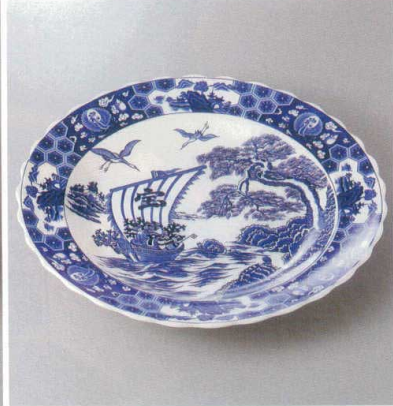
398-19-84J 8,700円 宝舟13号雪輪皿 41.5×5.5cm