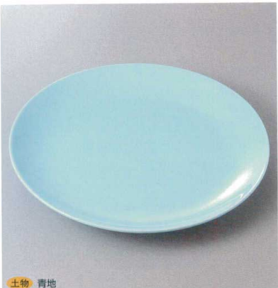
土物 青地 398-1-81J 4,200円 12号皿 37×4.5cm 398-2-81J 2,500円 10号皿 32×3.5cm

刺身・向付 中鉢・小鉢・組小鉢 小付・珍珠 土物 青地 松花堂・蓋向・内菓子碗・小吸碗 むし焼・土瓶むし 前菜皿 付皿・焼物皿・仕切皿 天皿・香水 組皿・和皿・組々皿・小皿 盛皿・オードブル 大鉢・盛鉢・組鉢・組井・ボール 酒樽・置き・卓上小物・箸スプレンゲ成皿