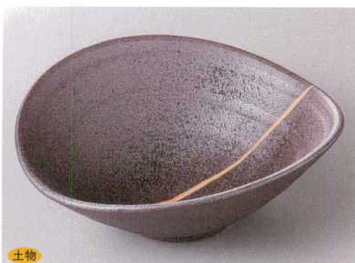
427-9-1J 2,350円 鉄釉ライン変形鉢(大) 21.5×18.8×7.5cm