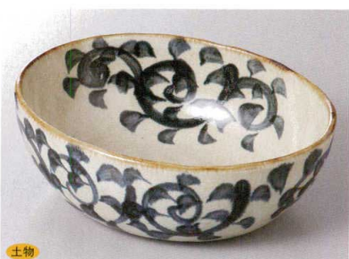
427-12-27J 2,000円 タコ唐草柄円鉢 17.5×15×6.2cm