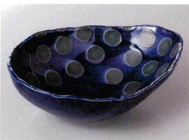
427-11-1J 2,100円 レインブルー変形ボール 22×16×7.5cm