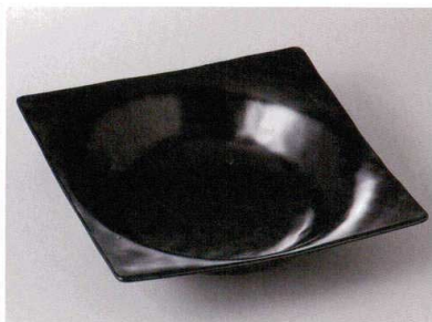
427-2-6J 2,600円 黒マット四角盛鉢(大) 22.1×22.1×5.2cm