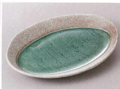
427-3-32J 2,350円 月光グレーの月23cm長丸皿 23×15.8×3cm