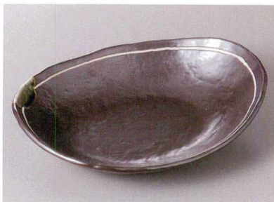
427-6-77J 2,890円 鉄釉一珍ライン小判鉢 24.8×19.2×5.4cm