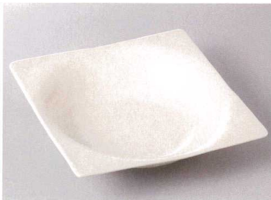
427-5-6J 2,600円 白マット四角盛鉢(大) 22.1×22.1×5.2cm