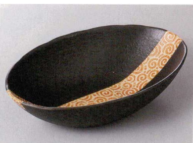
427-14-37J 1,980円 うず唐草(黒)アーモンド鉢(大) 22.2×14.2×5.2cm