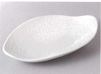
427-13-43J 2,000円 ウリ型盛皿 28.6×17.8×5.3cm