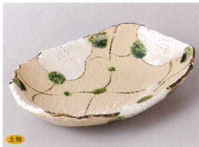
427-1-23J 3,000円 白格子花漬物皿 22×15×4.5cm