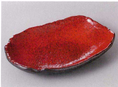
427-7-23J 2,850円 紅黒炭漬物鉢 21.7×14.5×4.6cm