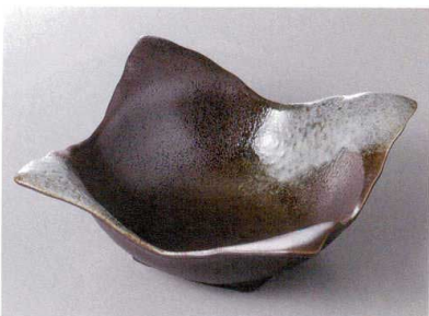
427-10-31J 2,100円 黒白吹四方鉢 大 19.1×19.1×8.8cm