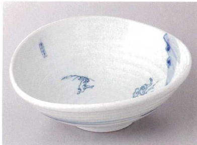
427-4-22J 3,000円 高山寺たわみ大鉢 21×19.5×7.5cm