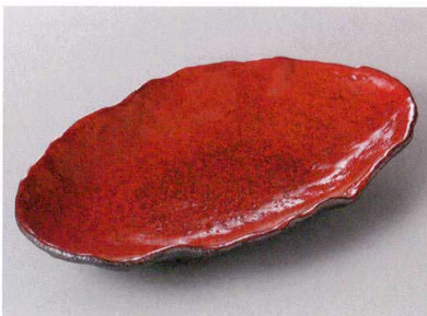
427-8-23J 2,850円 紅黒炭波瀾小判皿 25.3×14.25×3.7cm