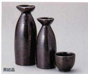
黒結晶 449-7-5J 1,050円 徳利大 20入 6.5×16cm 約300cc 449-8-5J 850円 徳利小 20入 5.7×13.5cm 約200cc 449-9-5J 450円 ぐい呑 5.5×4.4cm 約60cc