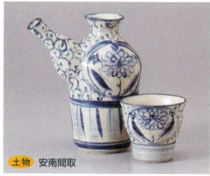
土物 安南間取 449-12-43J 6,800円 酒器 6入 8.5×13.5cm 約330cc 449-13-43J 2,620円 盃 7.5×6.1cm 約100cc