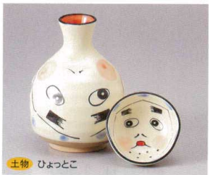
土物 ひよつこ 449-20-43J 2,530円 徳利 10入 9.2×11.4cm 約290cc 449-21-43J 870円 ぐい呑 6.2×2.8cm 約40cc