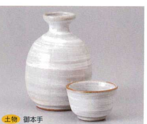
土物 御本手 449-34-41J 2,200円 徳利 10入 8.5×12cm 約360cc 449-35-41J 800円 盃 5.1×3.7cm