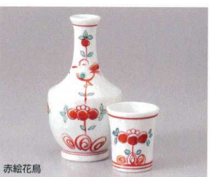
赤絵花鳥 449-30-43J 2,250円 徳利 10入 6.7×13cm 約150cc 449-31-43J 950円 グイ呑 4.5×5.4cm 約50cc