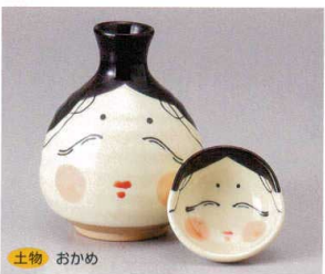
土物 おかめ 449-22-43J 2,530円 徳利 10入 9.2×10.9cm 約290cc 449-23-43J 870円 ぐい呑 6.2×2.8cm 約40cc