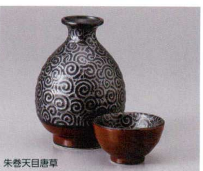
朱巻天目唐草 449-26-1J 2,250円 徳利 10入 8.5×12.5cm 約360cc 449-27-1J 1,100円 盃 6.8×4.1cm