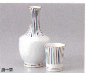
錦十草 449-32-43J 2,250円 徳利 10入 6.7×13cm 約150cc 449-33-43J 950円 グイ呑 4.5×5.4cm 約50cc