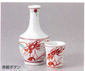
赤絵ボタン 449-28-43J 2,250円 徳利 10入 6.7×13cm 約150cc 449-29-43J 950円 グイ呑 4.5×5.4cm 約50cc