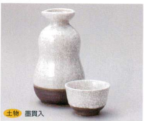
土物 墨買入 449-18-41J 2,500円 2号徳利 10入 8×14.3cm 300cc 449-19-41J 1,000円 盃 5.1×3.7cm