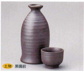
土物 黒備前 449-16-43J 2,530円 2号徳利 10入 7.2×13.5cm 約300cc 449-17-43J 760円 丸盃 5.2×4cm 約50cc