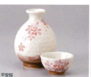
平安桜 449-40-10J 2,300円 徳利 10入 8.8×12.2cm 約400cc 449-41-10J 980円 盃 6.8×4cm