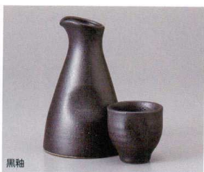
黒釉 449-10-6J 2,200円 徳利大 10入 9.3×15.5cm 約350cc 449-11-6J 1,300円 ぐい呑 6×6×6cm 約90cc