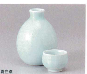
青白磁 449-38-1J 1,950円 2号徳利 10入 8.5×12.1cm 約310cc 449-39-1J 920円 盃 5×4cm