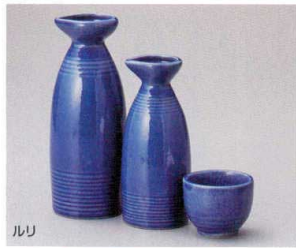
ルリ 449-1-5J 1,050円 徳利大 20入 6.5×16cm 約300cc 449-2-5J 850円 徳利小 20入 5.7×13.5cm 約200cc 449-3-5J 450円 ぐい呑 5.5×4.4cm 約60cc