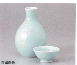
青磁首長 449-36-32J 2,100円 大徳利 10入 11.8×13.4cm 約320cc 449-37-32J 1,230円 グイ呑大 50入 7×3cm 約50cc