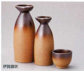
伊賀錆吹 449-4-5J 1,050円 徳利大 20入 6.5×16cm 約300cc 449-5-5J 850円 徳利小 20入 5.7×13.5cm 約200cc 449-6-5J 450円 ぐい呑 5.5×4.4cm 約60cc