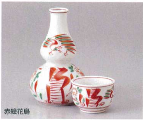
赤絵花鳥 449-14-5J 3,400円 徳利一徳利 10入 7.5×12.3cm 約160cc 449-15-5J 1,500円 丸ぐい呑 5×4cm 約50cc