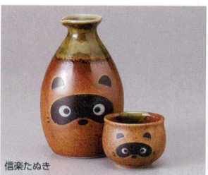
信楽ためき 449-24-10J 2,550円 2号徳利 10入 7×12.3cm 約270cc 449-25-10J 1,050円 ぐい呑 5.8×4.2cm