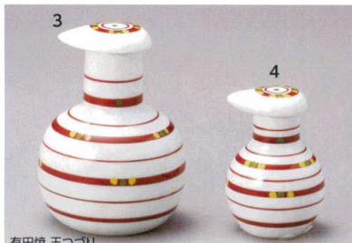
有田焼 玉つづり 485-3-93J 3,000円 スキット汁次(大) 1入 7.8×10.5cm 210cc 485-4-93J 2,900円 スキット汁次(ミニ) 1×80入 5×7.8cm 50cc