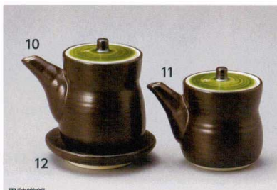
黒釉織部 485-10-71J 1,950円 汁次(大) 7.5×9.5cm 200cc 485-11-71J 1,800円 汁次(小) 7×8.5cm 150cc 485-12-71J 500円 受皿 9×1.5cm