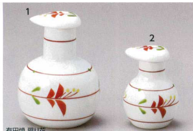
有田焼 廻り花 485-1-93J 3,000円 スキット汁次(大) 7.8×10.5cm 210cc 485-2-93J 2,900円 スキット汁次(ミニ) 1×80入 5×7.8cm 50cc