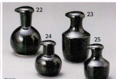
黒結晶 485-22-34J 2,100円 ミニ丸罫油差し 6.9×10.6cm 485-23-34J 2,100円 ミニ罫油差し 6.1×10.8cm 485-24-34J 1,650円 スモール丸罫油差し 5.4×7.1cm 485-25-34J 1,650円 スモール罫油差し 5.2×7.1cm