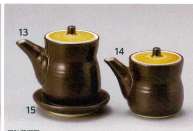
黒釉黄瀬戸 485-13-71J 1,950円 汁次(大) 7.5×9.5cm 200cc 485-14-71J 1,800円 汁次(小) 7×8.5cm 150cc 485-15-71J 500円 受皿 9×1.5cm