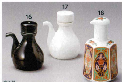
有田焼 485-16-93J 2,200円 黒キャップ汁次(ねじ式) 1×80入 7×10cm 150cc 485-17-93J 2,200円 白キャップ汁次(ねじ式) 1入 7×10cm 150cc 485-18-93J 2,800円 古伊万里木甲汁次(大) 7.5×13.6cm 250cc