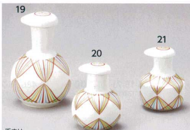
手まり 485-19-34J 3,650円 ミニ丸罫油差し 6.9×10.6cm 485-20-34J 3,000円 スモール丸罫油差し 5.4×7.1cm 485-21-34J 3,000円 スモール罫油差し 5.2×7.1cm