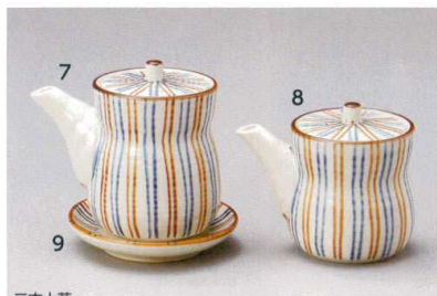
二本十草 485-7-71J 2,200円 汁次(大) 7.5×9.5cm 160cc 485-8-71J 2,000円 汁次(小) 7×8.5cm 150cc 485-9-71J 600円 受皿 9×1.5cm