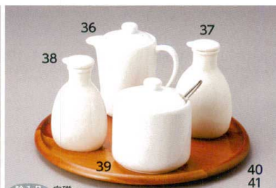
輸入品 白磁 485-36-43J 480円 汁次 6.2×10.8cm 190cc 485-37-43J 410円 NB汁次(大) 6.5×5.5×10.6cm 130cc 485-38-43J 380円 NB汁次(小) 6.2×5.2×9.8cm 110cc 485-39-43J 630円 シュガーポット(スプーン付) 8.2×9cm 260cc 485-40-90J 1,000円 (木)カスター台(小) 20φ×1.5cm 485-41-90J 1,100円 (木)カスター台(大) 23φ×1.5cm