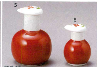
有田焼 赤巻 485-5-93J 3,000円 スキット汁次(大) 7.8×10.5cm 210cc 485-6-93J 2,900円 スキット汁次(ミニ) 1×80入 5×7.8cm 50cc