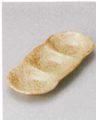
510-9-33J 1,560円 窯変令和イラボ三品盛 18×7.5×2cm