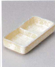
510-24-79J 1,100円 石焼芦二品盛 16.5×8cm