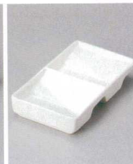
510-28-43J 1,000円 ヘルシー二連調味入白 14.5×8×2.2cm