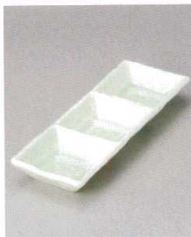
510-8-2J 2,200円 ヒワ軸三つ仕切鉢 22×7.4×2.7cm