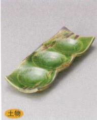
510-3-1J 1,800円 錆刷毛織部三連皿 18.8×7×2.2cm