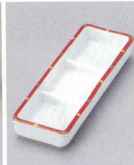
510-30-71J 1,400円 淵赤絵三品盛 18.1×16.1×2.6cm