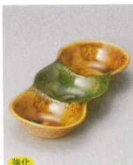
510-7-78J 1,760円 黄瀬戸織部珍味三つ仕切 21.7×9.4×3.2cm