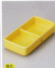
510-23-79J 1,690円 黄輝二品盛(深口) 16.3×8×3.3cm