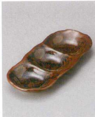
510-10-33J 1,560円 窯変令和天目三品盛 18×7.5×2cm