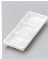
510-15-8J 1,050円 白足付三つ仕切皿 20.5×8×3cm