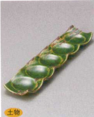
510-1-1J 2,800円 錆刷毛織部五連皿 30×7.2×2.2cm