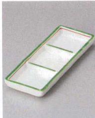
510-17-79J 1,380円 淵グリーン三品盛 16×5.5cm