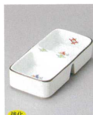
510-19-79J 2,000円 赤絵小花二品盛 14.5×7×3.4cm