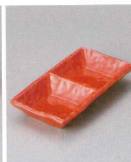
510-20-34J 1,800円 朱二品皿 15×7.6×2.6cm