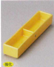
510-18-79J 1,470円 黄輝二品盛 18.5×4×3.3cm