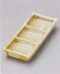
510-5-79J 1,550円 白タタキ三品盛 19×8×3cm