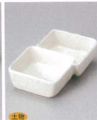
510-29-43J 1,080円 粉引クリームちび四角 14.7×9.3×3.8cm