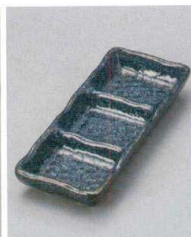
510-14-8J 1,050円 藍足付三つ仕切皿 20.5×8×3cm