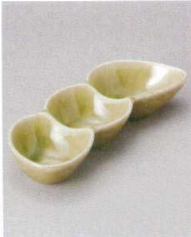
510-11-32J 1,500円 灰軸三品入 19.3×7×3.2cm