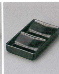
510-27-43J 1,000円 ヘルシー二連調味入黒 14.5×8×2.2cm