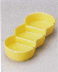
510-12-71J 1,200円 黄軸二彩丸型三品皿 18.3×7.2×3cm