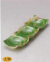
510-2-1J 3,100円 錆刷毛織部三連深皿 26×8.5×2.5cm