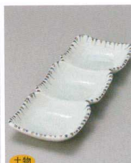
510-13-79J 1,100円 青磁二色十草角切三品皿 26×8.8×2.5cm