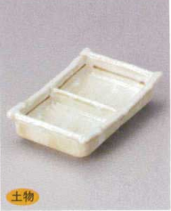
510-6-79J 1,250円 白タタキ三品盛 13.5×8.2×3cm