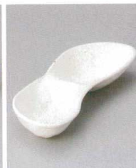
510-21-32J 1,430円 白釉二品入 18.4×6.8×3.1cm