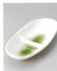
510-25-27J 1,650円 グリーン仕切長盛鉢 22×10×3.8cm