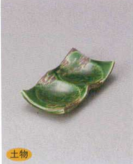
510-4-1J 1,300円 錆刷毛織部二連皿 12×6.5×2cm