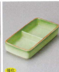
510-22-79J 1,690円 緑彩二品盛(深口) 16.3×8×3.3cm