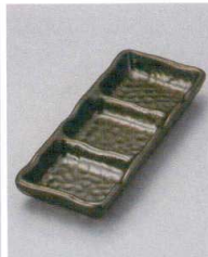
510-16-8J 1,050円 天目足付三つ仕切皿 20.5×8×3cm