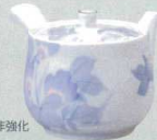
626-33-48J 4,700円 急須 6入 10.8×10.1cm 420cc 非強化