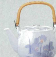
626-40-48J 9,750円 10号土瓶 1入 16×14cm 1400cc 非強化