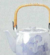
626-39-48J 7,800円 7号土瓶 1入 14.3×13.5cm 1000cc 非強化