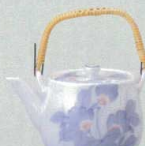
626-38-48J 5,800円 4号土瓶 6入 12×11.7cm 600cc 非強化