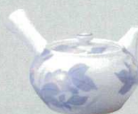
626-34-48J 4,200円 京形急須 6入 10.7×7.7cm 300cc 非強化