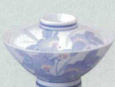
626-31-48J 4,150円 蓋付大茶 14.8×9.2cm