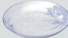
626-20-48J 2,300円 新丸6.0皿 19.2×3.2cm 626-21-48J 3,000円 新丸7.0皿 21.5×3.5cm