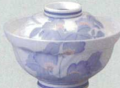
626-32-48J 4,150円 蓋井 15.3×10.5cm