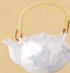
631-45-48J 5,400円 京形土瓶 6入 12.3×7.8cm 400cc