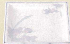
631-13-48J 7,050円 角割正角大皿 22×22×3.5cm