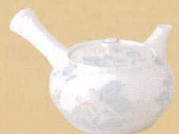
631-44-48J 4,100円 京形急須 6入 10.8×8cm 300cc