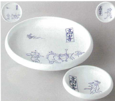
強化 イングレ 高山寺

84-19-78J 4,200 円 八角刺身鉢 15.5×6.3cm 84-20-78J 1,740 円 八角千代久 8.5×3cm