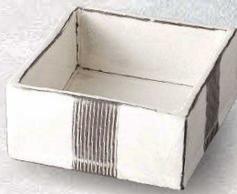
土物 94-1-2J 7,500円 黒土白化粧一本くし目角鉢 大 11.5×11.5×3.2cm