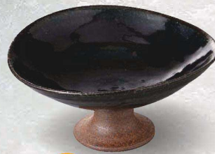
土物 94-3-48J 8,000円 紺釉変形高台鉢 16×14×7cm