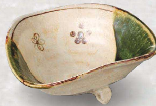
土物 94-6-2J 7,000円 織部鉄仙三ツ足向付 16×16×6cm