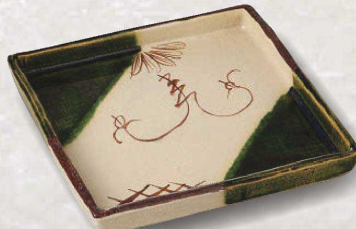
土物 94-5-71J 7,400円 織部つる花正角皿 18.5×18.5×2.6cm