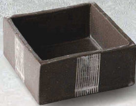
土物 94-2-2J 7,500円 黒土一本くし目角鉢 大 11.5×11.5×5.1cm