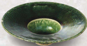
土物 94-4-22J 7,800円 本織部カクテルプレート 19×5.2cm