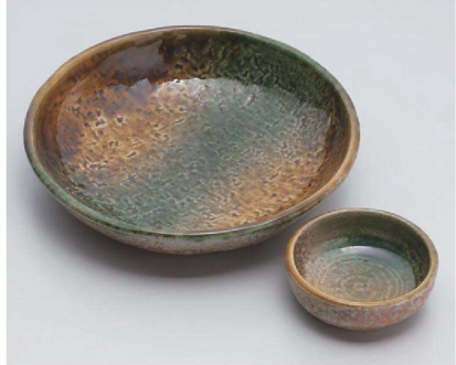
10-105-743 2,500円 黄瀬戸織部刺身鉢(16.4×3.4) 10-106-743 1,050円 黄瀬戸織部丸千代口(6.7×2.5)