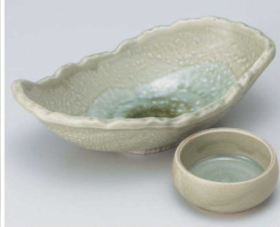
10-103-353 1,500円 ぎやまんグレーひねり型向付(18.9×11.6×6.2) 10-104-353 850円 ぎやまんグレー丸千代口(7.2×3)