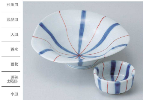
10-201-303 2,800円 十章朱線なぶり向付(15.6×5.4) 10-202-303 1,400円 十章朱線丸千代口(6.2×3)