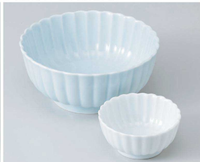
10-203-603 2,730円 青磁菊型丸刺身鉢(15.4×6.5) 10-204-603 1,110円 青磁菊型丸刺身千代口(8.5×4)