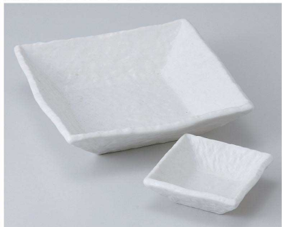
10-205-473 2,200円 白マット正角5.0平鉢(16.3×16.3×4.3) 10-206-473 850円 白マット正角千代口(8×8×2.8)