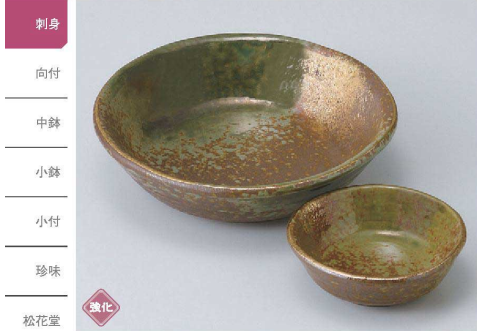
10-101-743 2,700円 金彩吹織部丸刺身鉢(15.5×4) 10-102-743 1,280円 金彩吹織部丸千代口(8.8×2.8)