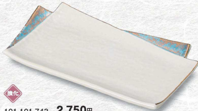
強化 101-101-743 2,750円 黄地金彩折紙長皿 (22.5×11.5×2.3)