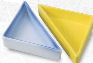
強化 101-303-743 1,300円 吹付ルリ三角松花堂(15.3×10.8×2.9) 101-304-743 1,230円 レモン三角松花堂(15.3×10.8×2.9)