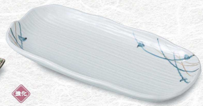
強化 101-103-703 1,750円 新むさしの松花堂長皿 (22.3×11×2.5)