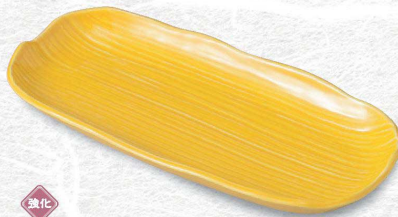
強化 101-202-703 1,800円 黄輝松花堂長皿 (22.3×11×2.5)