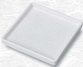
強化 101-201-263 1,750円 ハール四角蓋 (10.3×10.3×1.6)