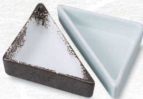
強化 101-301-703 1,300円 鉄仙花白吹三角松花堂(15.3×10.8×2.9) 101-302-703 1,230円 青白磁三角松花堂(15.3×10.8×2.9)