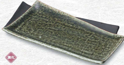
強化 101-102-703 2,160円 桃山織部松花堂長皿 (22.5×11.5×2.3)