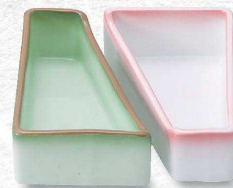
強化 101-305-703 1,120円 緑彩台形鉢(102×6.7×4) 101-306-703 1,120円 ピンク吹台形鉢(102×6.7×4)