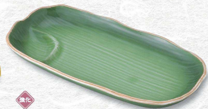
強化 101-203-703 1,750円 緑彩松花堂長皿(仕切付) (23×11.3×2.5)