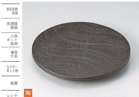
104-303-303 4,500円 あら黒ロックプレート(中) (21×4.2)