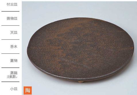
104-103-053 2,400円 金結晶変形10角20cm皿 (20×1.5)