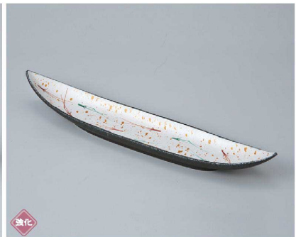
強化 105-303-253 5,900円 強化ラスター舟形9.0前菜皿 (27×5×3.6)