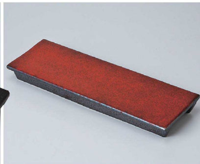
105-302-303 3,800円 紅黒炭レール(中) (31×10×3.3)