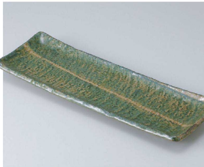
105-401-743 4,400円 緑彩貫入長魚皿(大) (36.5×12.5×3.2)