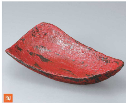
陶 105-201-053 5,600円 炭化土根来尺鉢 (29.5×17×7)