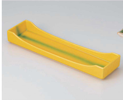
105-101-263 5,200円 黄釉緑彩箱長皿 (30.5×8×3.8)