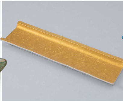
105-402-053 5,500円 石肌両上り11.0皿ゴールド (33.5×10.3×2.5)