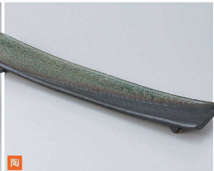
陶 105-203-843 4,700円 楡目オリベ細長角皿 (手造) (45×9×4)