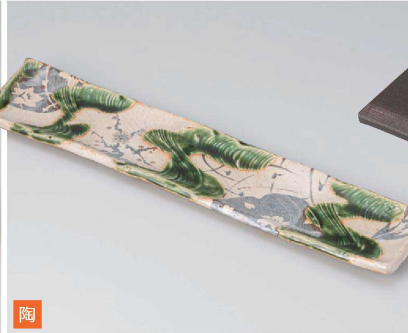
陶 105-102-053 8,300円 手造り 流水春秋付出皿 (38×8×2)