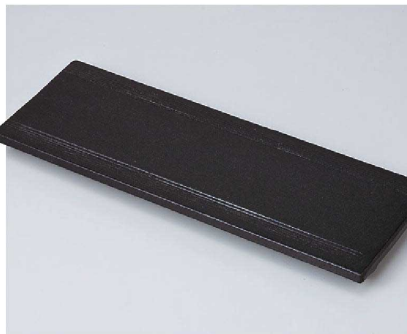
105-301-083 4,700円 黒柚子36cm長皿 (36.5×12.2×2.5)