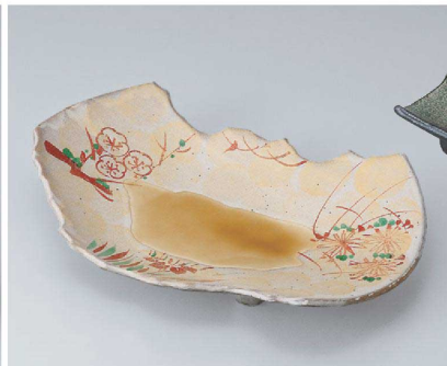
105-202-053 4,700円 四君子ちぎり皿 (29.5×19×5.5)