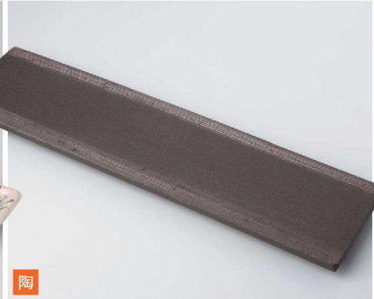
陶 105-103-303 5,300円 炭化土吹15.0長皿 (46×12×2.5)