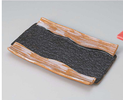
107-101-353 4,150円 信楽金銀彩石目長皿 (23.5×16.5×2)