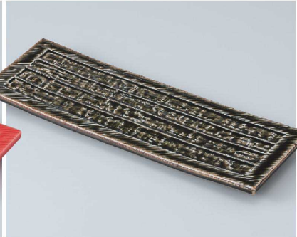
107-103-053 4,500円 織部彫入長皿 (32.5×11.3×2.5)