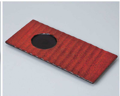
107-303-303 3,800円 紅黒炭カップ置長皿 (26.5×12.3×1.7)