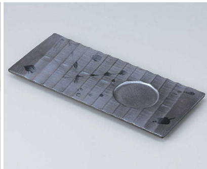
107-202-303 4,000円 ラスター彩カップ置長角皿 (26.5×12.3×1.7)