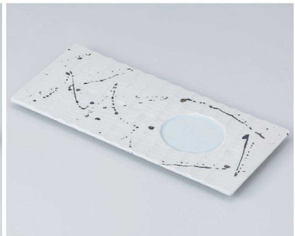
107-203-353 4,350円 黒飛ばしラスター青磁長角前菜皿 (26.7×12.3×1.5)