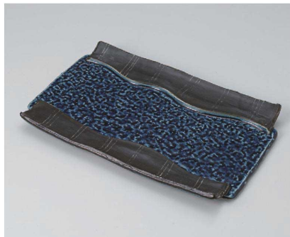
107-301-473 3,900円 淡ルリ黒彫石目長皿 (23.5×16.5×2)