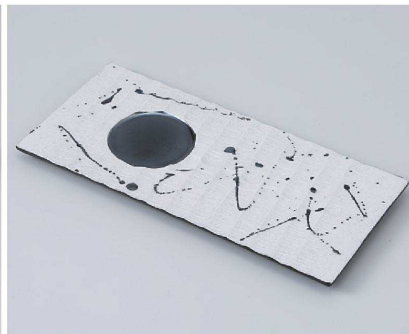
107-302-353 4,350円 黒飛ばしラスター黒釉長角前菜皿 (26.8×12.4×1.5)