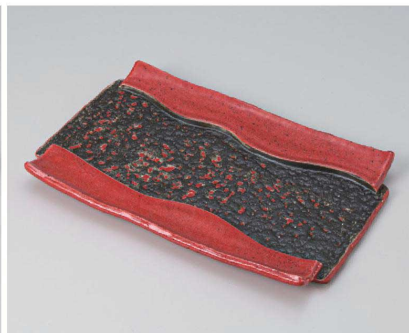
107-402-473 3,900円 内黒レッド石目長皿 (23.5×16.5×2)