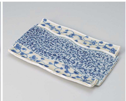
107-403-353 3,400円 安南呉須花石目長皿 (23.5×16.5×2)