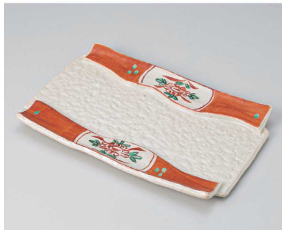
107-201-473 4,100円 粉引赤絵間取石目長皿 (23.5×16.5×2)