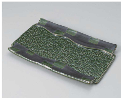
107-401-473 3,900円 織部市松石目長皿 (23.5×16.5×2)