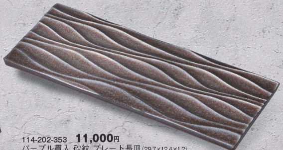
114-202-353 11,000円 パール貴入 砂紋 プレート長皿 (29.7×12.4×1.2)