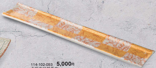
114-102-053 5,000円 金彩市松細長皿 (40×7×1.5)