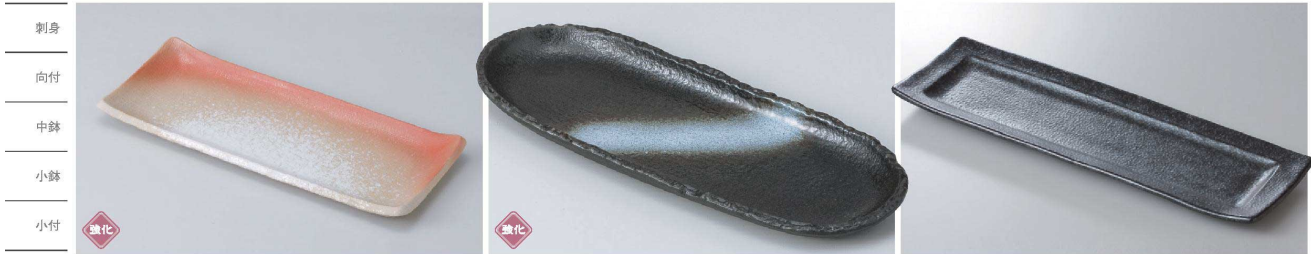
118-101-703 2,150円 雪どけ鮎皿 (25.3×10.7×2) 118-102-783 2,300円 白吹き黒水晶 10.0楕円長皿 (30.3×11×2.4) 118-103-573 2,000円 黒銀彩 付出皿 (28×9×17)