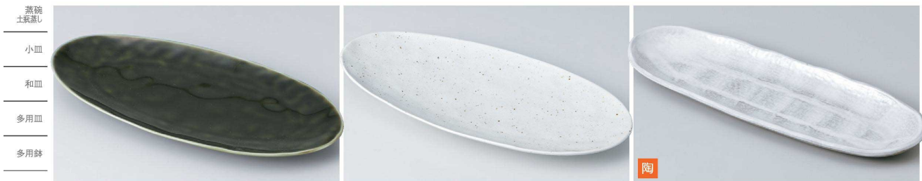
118-301-473 2,300円 織部9.0楕円皿 (27.3×12.8×2.4) 118-302-353 2,250円 白粉引楕円9.0皿 (26.5×12.5×2.5) 118-303-793 1,660円 ウノネリ込小判付皿 (27×9.3×1.8)