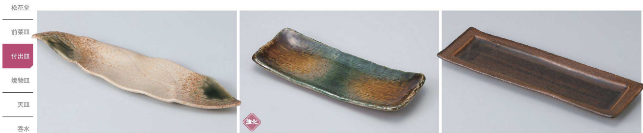
118-201-473 2,000円 伊賀織部若葉型前菜皿 (27.3×6.7×1.8) 118-202-743 2,000円 黄瀬戸織部突出皿 (23.5×9×2.5) 118-203-153 2,000円 回茶回付出皿 (27.5×8.8×1.5)