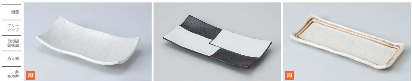
118-401-743 1,650円 真珠浜付焼物皿 (19.5×10×3.5) 118-402-703 1,670円 古代市松付出皿 (21×9.8×2.3) 118-403-473 1,500円 クリーム粉引ライン付出皿 (24×9.5×2)