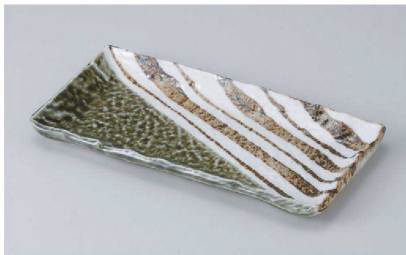
119-502-783 1,240円 織部ストライプ付皿 (20.7×10.3×2)