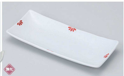
119-203-743 1,500円 小花(赤) 付出皿 (22×10×2.7)