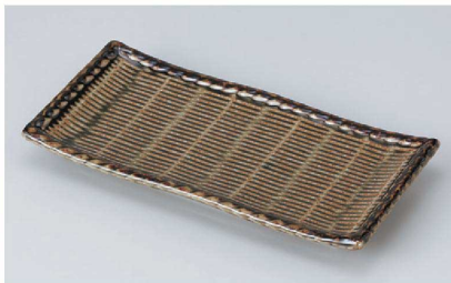
119-402-603 1,360円 渋草 かごめ付皿 (22.5×11×2.8)