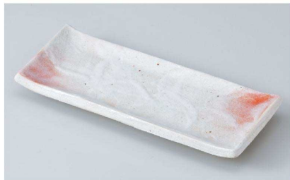
119-401-163 1,360円 桜志野付皿 (22.5×9.5×3)