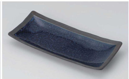
119-503-473 1,200円 桃山藍彩付皿 (22.2×10.2×2.7)