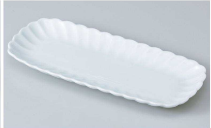
119-103-603 1,820円 青磁菊型 付出皿 (24×10.3×2.2)