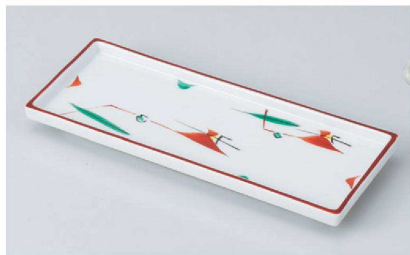
119-201-793 1,520円 赤絵つゆ草長角付皿 (21×8×2.3)