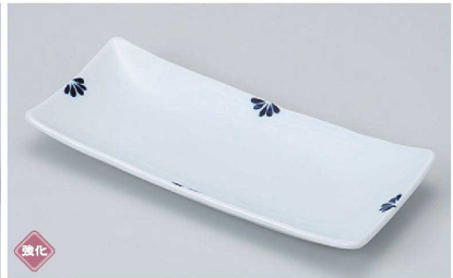
119-303-783 1,500円 小花 青 突出皿 (22×10×2.7)