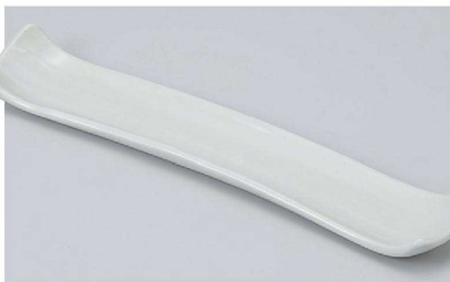
119-202-083 1,500円 アイボリー27cm長角トレイ (27.2×2.5)