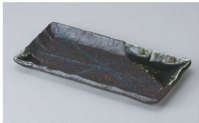
119-501-783 1,500円 南蛮乱十草付皿 (20.5×10.3×1.8)