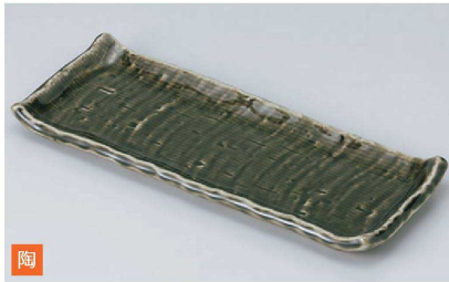
119-302-473 1,400円 織部付皿 (24.5×9.8×2.3)