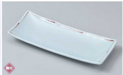
119-403-783 1,320円 赤ライン付皿 (21.5×9.7×2.5)