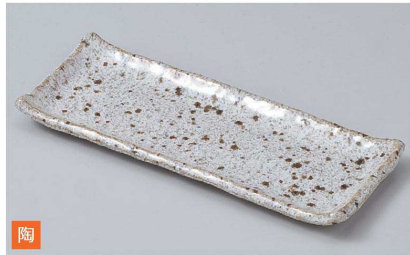
119-301-473 1,400円 うのふ斑点付皿 (24×9.5×2.2)