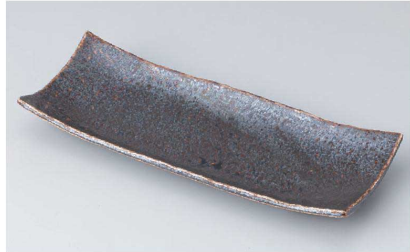
119-101-253 1,500円 浜付き突出いぶし銀結晶 (24.1×9.6×3.2)