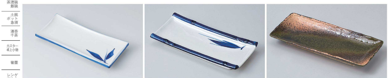
茶漬碗 飯碗 120-501-793 890円 液性見換 特選 竹竹コス付出皿 (16.5×11×2.6) 120-502-793 900円 竹測三ツ笹付出皿 (21×9.5×2.5) 120-503-303 750円 オリーブ吹付出皿 (23×10.5×2.5)