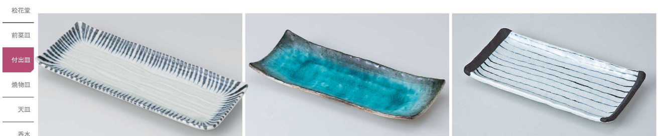
松花堂 120-201-163 1,250円 呉須十草 そぎ長角皿 (27.5×11.1×2.8) 120-202-013 1,170円 均窯スカイ付出皿 (24.1×9.7×2.8) 120-203-473 1,150円 いぶし測黒十草付出皿 (21.5×10.2×2.5)