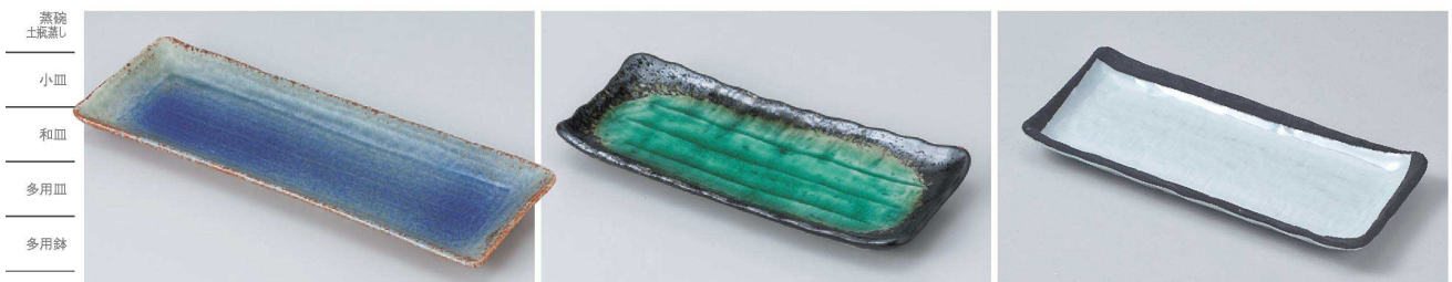
蒸碗 土瓶蒸し 120-301-263 1,150円 琉璃長角皿 (28×10×2) 120-302-473 1,100円 深海グリーン付出皿 (22.8×9.5×2.5) 120-303-473 1,100円 桃山石目付出皿 (21.7×10.2×2.3)