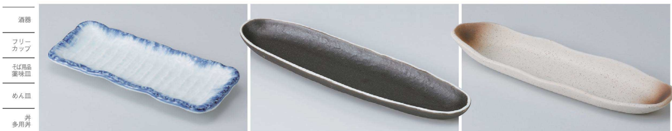
酒器 120-401-303 1,100円 液性見換 特選 呉須刷毛付出皿 (22×10×2.6) 120-402-263 1,000円 黒釉細長皿 (32×8.5×2.2) 120-403-523 1,050円 白伊賀吹付出皿 (27.8×7.8×2.5)