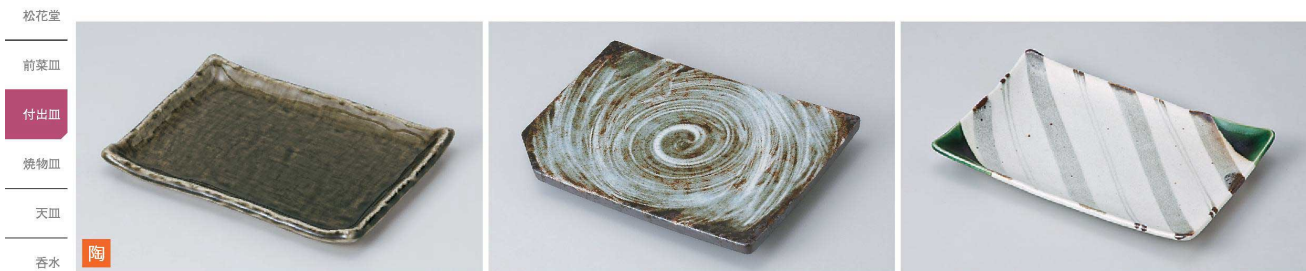
蓋物 122-201-473 1,700円 織部7.0長角皿 (20.8×14.8×2.5) 122-202-163 1,570円 白刷毛寿司皿 (21.5×14.8×2.5) 122-203-473 1,350円 織部志野ライン7.0焼物皿 (20.3×13×2.6)