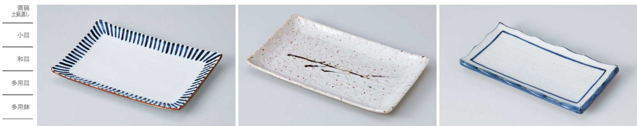
盛込鉢 122-301-473 1,350円 藍十草7.0焼物皿 (20.3×13×2.6) 122-302-633 1,600円 乱刷毛 24cm長角皿 (23.8×14.4×2) 122-303-473 950円 布目ライン付出皿 (19.5×9.5×2) 盛込皿