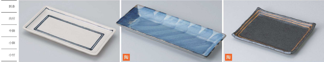
珍珠 122-101-793 1,980円 布目帯ライン貼皿 (23×11.8×2) 122-102-603 1,840円 灰釉ゴス長角皿 (中) (29×11.5×2.5) 122-103-473 1,750円 黒ライン7.0長角皿 (20.3×14.3×2.3)