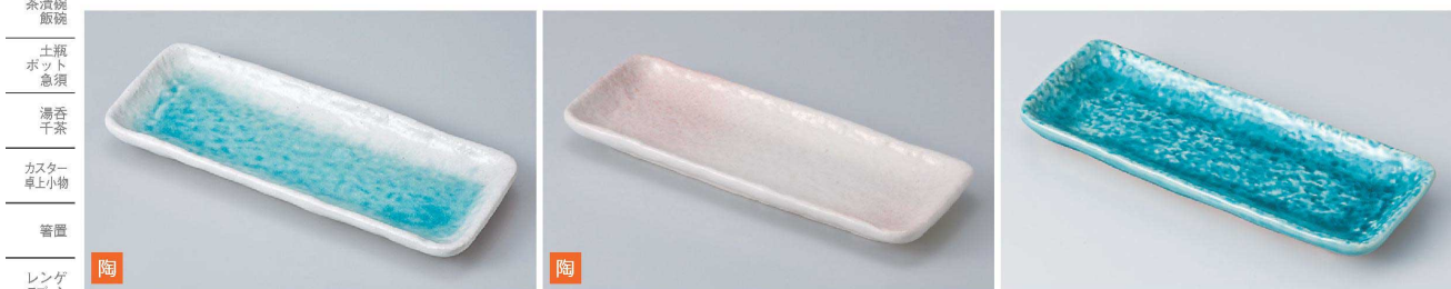
レンゲ スプーン 122-501-793 700円 白流水付付出皿 (21.3×8.3×2.1) 122-502-793 700円 桜志野付付出皿 (小) (21.3×8.3×2.1) 122-503-793 700円 トルコ付付出皿 (21.3×8.3×2.1) 灰皿