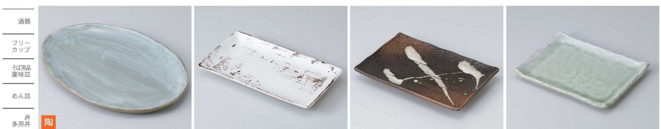
酒器 128-401-743 2,300円 刷毛目青雲椿円焼物皿 (25×17.8×1.5) 128-402-083 1,900円 錆粉引千段焼物皿 (23.8×13.5×2.5) 128-403-633 1,800円 南蛮23.5cmたたき皿 (23.5×16.1×3) 128-404-743 1,650円 白化粧7.0焼物皿 (20.5×14.5×2)