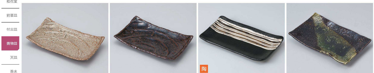
前菜皿 128-201-633 2,700円 窯変いらば23cm焼物皿 (22.8×14×3.3) 128-202-633 2,700円 窯変天目23cm焼物皿 (22.8×14×3.3) 128-203-783 3,000円 ゆず黒錆十草焼物皿 (25.5×14.5×2.8) 128-204-353 2,100円 天の川華長角皿 (24×13.5×3.2)