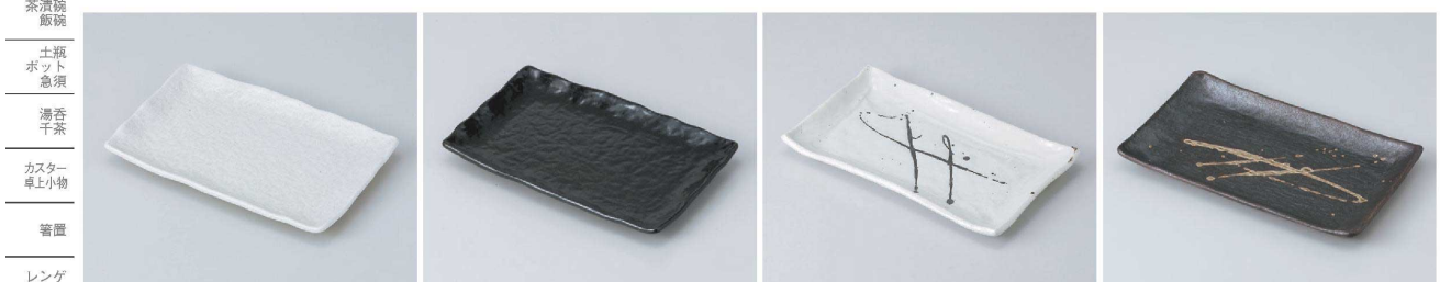
茶漬碗 128-501-013 1,980円 ゆず白陽 串皿大 (21.3×13.3×2) 128-502-013 1,980円 ゆず黒耀 串皿大 (21.3×13.3×2) 128-503-153 1,500円 粉引黒筆流し長角焼物皿 (22×12.2×2) 128-504-153 1,300円 筆流し木肌焼物皿 茶 (24×14.5×2.3)

流仕見換 特選 土瓶 ポット 急須 湯呑 干茶 カスター 卓上小物 箸置 レンゲースプーン 灰皿