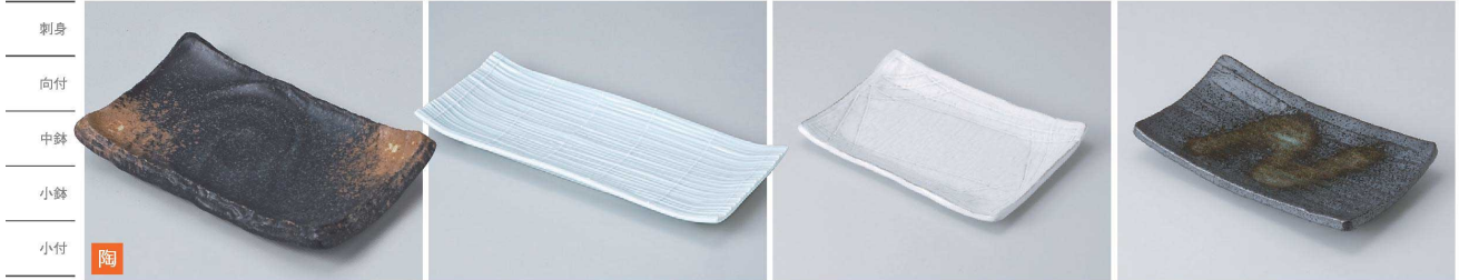
刺身 128-101-513 3,600円 黒備前足付焼物皿(大) (33×14×3) 128-102-793 2,880円 青磁すだれ9.0長角皿 (28×11.5×2.8) 128-103-743 2,250円 白檀7.0焼物皿 (21.2×13.4×2.3) 128-104-513 1,800円 南蛮Nライン焼物皿 (21.7×12×2.3)