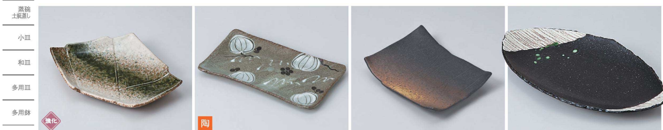
蓋物 128-301-793 2,200円 緑川 結び7.0皿 (21.2×15.5×2.5) 128-302-703 2,660円 山帰来焼物皿 (25.5×14×2.8) 128-303-353 2,350円 黒備前四ツ足焼物皿 (21×16.5×3) 128-304-353 2,650円 黒織部角楯目型焼物皿 (29.7×16×2.8)