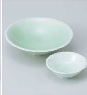
13-105-413 1,500円 もえぎ輪花 向付(14.8×4.2) 13-106-413 500円 もえぎ輪花 千代口(8.3×3)