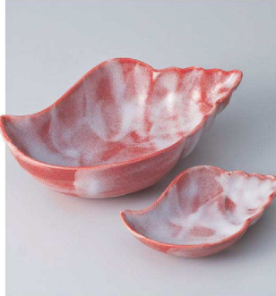
13-301-163 1,480円 赤彩巻貝鉢(18.5×13×5) 13-302-163 740円 赤彩巻貝千代口(12.3×17.7)