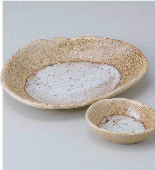
13-203-353 1,500円 伊賀帯変形皿(20×16×3.3) 13-204-353 680円 伊賀帯変形千代口(9.5×7.8×2.6)