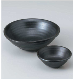
13-401-403 900円 新黒結晶三ツ足向付(16×5.8) 13-402-403 380円 新黒結晶三ツ足千代口(9.2×3.8)