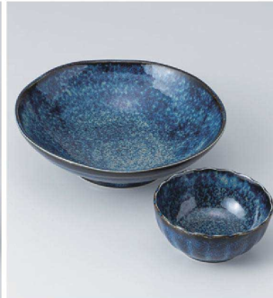
13-405-403 620円 窯変紺 六兵向付(17×4.9) 13-406-403 480円 窯変紺 菊形千代口(9×3.9)