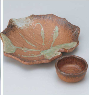
13-107-513 4,000円 信楽風木ノ葉刺身皿(20.2×18.5×4.4) 13-108-513 1,000円 信楽風木の葉千代口(6.8×3.2)