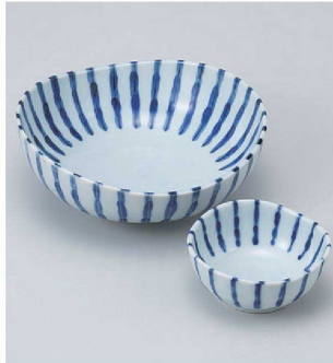
13-403-403 880円 濃十草楕円向付(17×16.5×6) 13-404-403 460円 濃十草三角千代口(9×9×4)