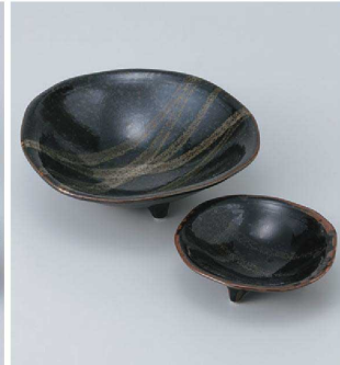
13-207-253 1,600円 油滴三つ足5.0鉢(15.5×4.6) 13-208-253 750円 油滴三つ足3.3鉢(10×2.8)