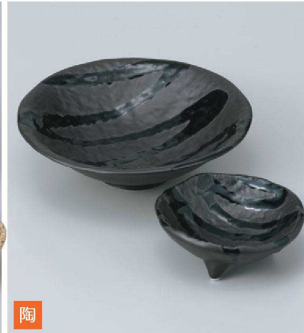
13-205-413 1,500円 ひるがの 向付(15.5×4.5) 13-206-413 720円 ひるがの 千代口(8.5×3.6)