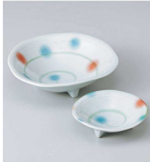
13-201-263 1,500円 風車三ツ足刺身鉢(15.5×4.5) 13-202-263 750円 風車三ツ足3.0鉢(10×3)