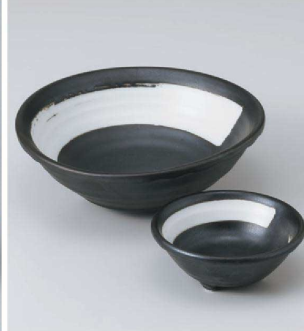
13-305-353 920円 黒マット三つ足5.0鉢(16.7×16×5.7) 13-306-353 400円 黒マット三つ足3.0鉢(9.5×3.7)