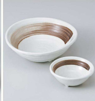
13-307-353 920円 白マット三つ足5.0鉢(16.7×16×5.7) 13-308-353 400円 白マット三つ足3.0鉢(9.5×3.7)