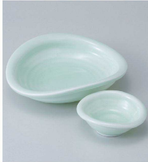
13-103-473 1,500円 もえぎたわみ向付(17×15×4.5) 13-104-473 800円 もえぎたわみ千代口(9×8.3×3)