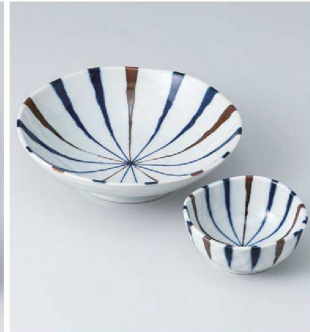
13-407-403 580円 藍十草向付(17×4.9) 13-408-403 450円 藍十草三角千代口(9×3.9)