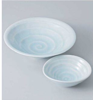
13-101-473 1,500円 青白磁うず潮向付(15×4) 13-102-473 800円 青白磁うず千代口(9.2×3.2)