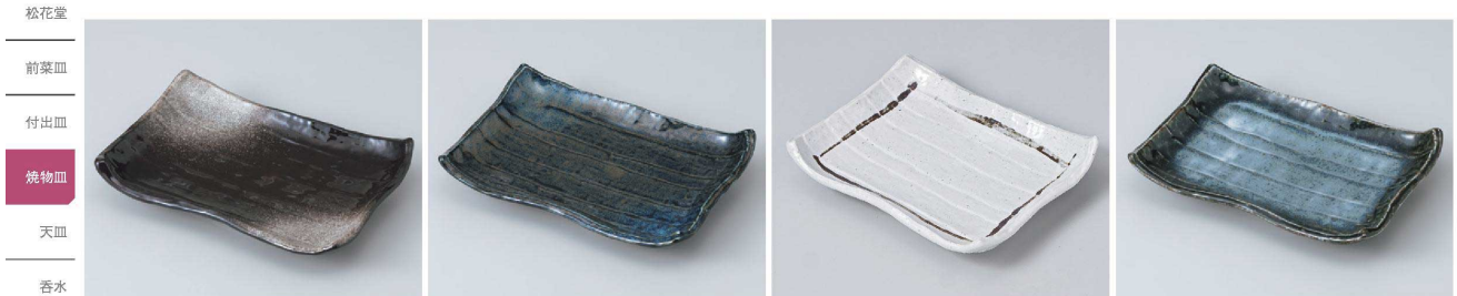
130-201-473 1,400円 あけぼの波型焼物皿 (21×4.5×4) 130-202-473 1,400円 オーロラ波型焼物皿 (20.8×14.5×4) 130-203-473 1,400円 粉引ライン波型焼物皿 (21×14.5×4) 130-204-473 1,400円 おぼろ月波型焼物皿 (21×4.5×4)