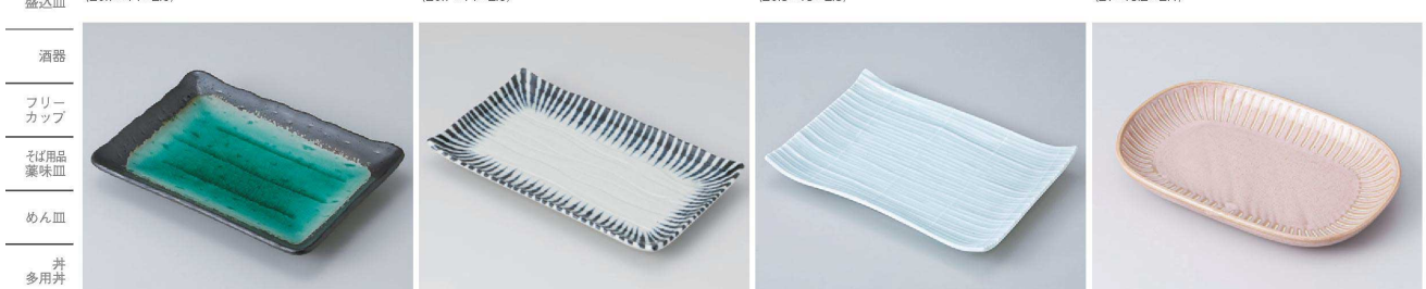
130-401-473 1,450円 深海グリーン焼物皿 (21×14.5×3) 130-402-163 1,250円 呉須十草 そぎ焼物皿 (22.5×13.3×2.5) 130-403-793 1,440円 青磁すだれ8.0焼物皿 (20.5×14.2×3) 130-404-013 950円 撥水十草 小判皿 桃うのふ (18.7×12.8×2.5)