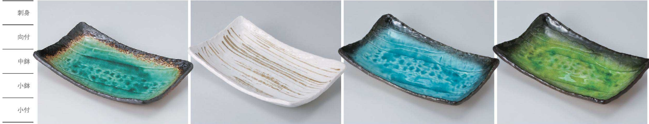
130-101-253 2,600円 緑彩手作り長角皿 (26×16.5×4.5) 130-102-253 2,600円 白樺手作り長角皿 (26.5×16.5×5) 130-103-013 2,280円 藍染スカイ長角皿(大) (26×16×4.5) 130-104-013 2,280円 藍染ヒワ長角皿(大) (26×16×4.5)