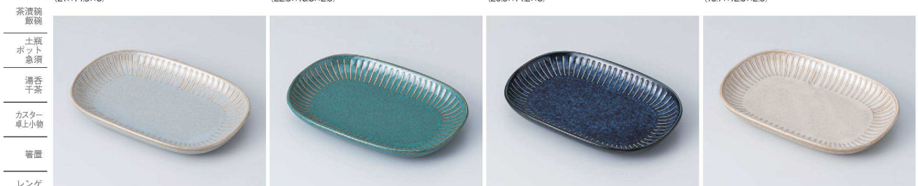
130-501-013 950円 撥水十草 小判皿 灰うのふ (18.7×12.8×2.5) 130-502-013 950円 撥水十草 小判皿 クジャク (18.7×12.8×2.5) 130-503-013 950円 撥水十草 小判皿 海碧 (18.7×12.8×2.5) 130-504-013 950円 撥水十草 小判皿 チタンマット白 (18.7×12.8×2.5)