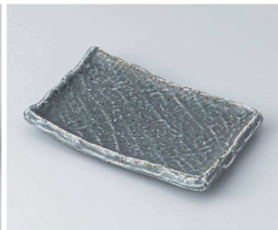
131-503-513 1,900円 匠串皿 土物風ブルー (17.5×12.5×2.5)