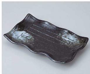
131-401-613 900円 天目白吹波型焼物皿 (20.5×12.5×3)