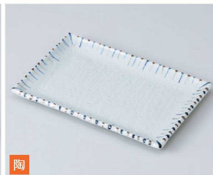
131-203-703 1,200円 荒目青磁二色十草新焼物皿 (20×13.5×1.5)