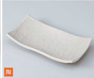
131-103-793 1,300円 白志野浜付焼物皿 (19×10×3.5)