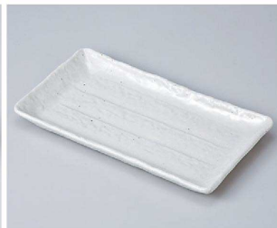
131-303-783 950円 白釉焼物皿 (21×11.6×1.8)