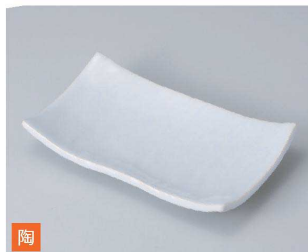
131-201-783 1,400円 均窯焼物皿 (19.5×10×3.5)