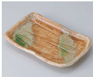
131-501-613 900円 そぎ型焼物皿 伊賀 (21×13.5×2.8)