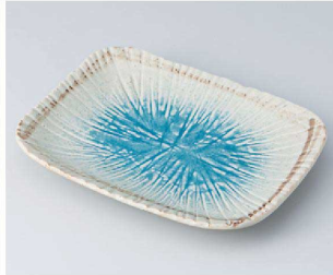
131-102-263 1,650円 湧水20.5cm長角皿 (20.5×16×2.6)