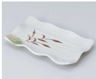
131-301-403 910円 金彩芦波形焼物皿 (20.8×12.8×3)