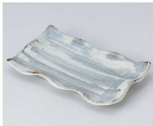
131-302-403 910円 藍染波形焼物皿 (20.8×12.8×3)