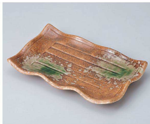
131-402-613 900円 伊賀波型焼物皿 (20.5×12.5×3)