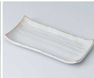
131-504-783 1,500円 窯変白 焼物皿 (22.7×11×2.3)