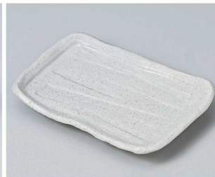
131-404-613 900円 そぎ型焼物皿 粉引 (21×13×2.8)