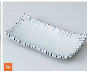
131-204-703 1,200円 荒目青磁二色十草浜付焼物皿 (19.5×10×3.3)