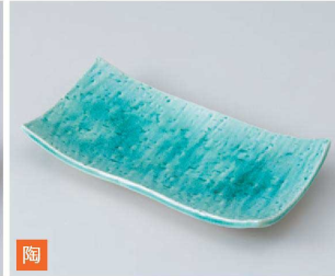
131-104-793 1,300円 トルコ浜付焼物皿 (19×10×3.5)