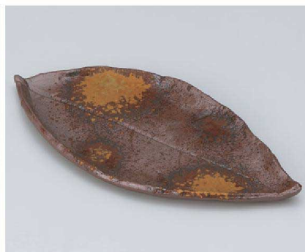
131-202-253 1,200円 びぜん柿の葉(大) (19×9.5×1.5)