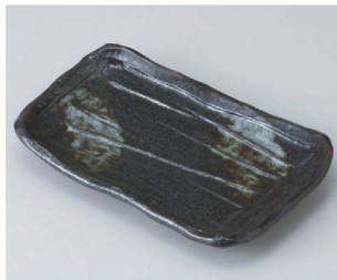
131-502-613 900円 そぎ型焼物皿 天目白吹 (21×13.5×2.8)