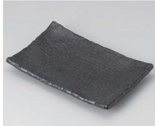
131-101-613 2,000円 黒備前濃焼物皿 (22×15×3)