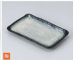
131-403-793 800円 雲竜6.0長角皿 (17.5×12×2.2)