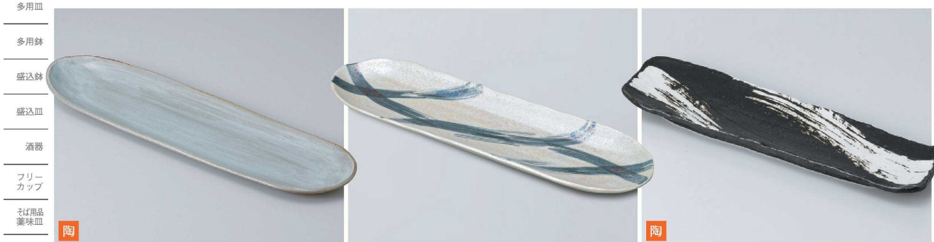
144-203-473 2,600円 桃山藍彩長皿 (33.3×11.2×2.5)