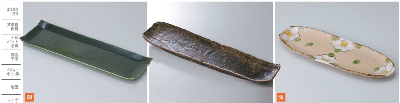
144-303-413 2,400円 黒炭白刷毛 長皿 (35.3×9.9×2.9)