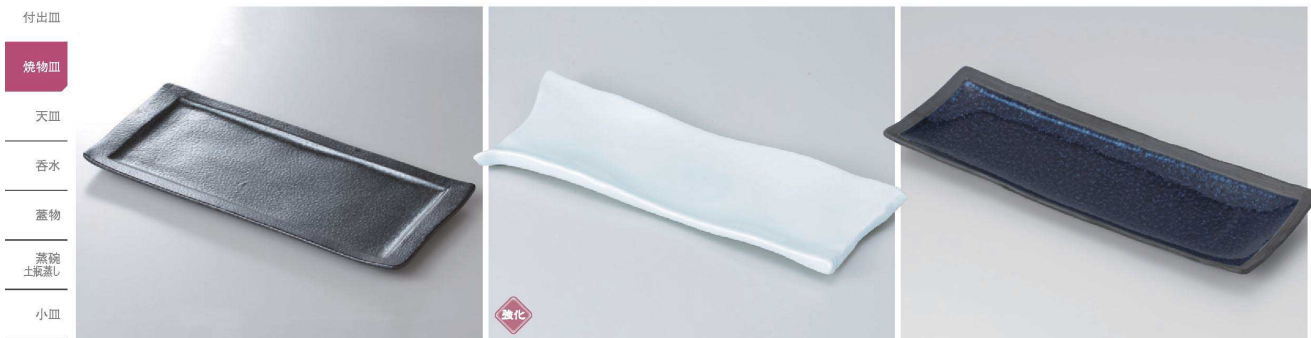
144-103-523 3,600円 備前風回角焼物皿 (大) (31.5×14×2)