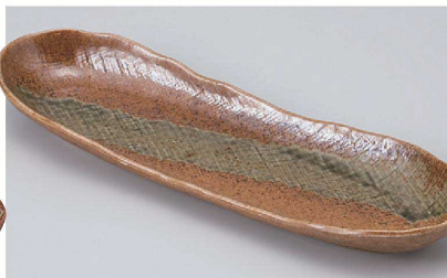
149-202-403 1,050円 伊賀 舟形長皿 (33×10×3.8)