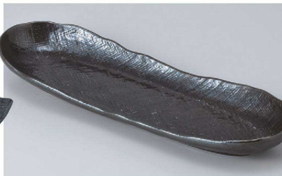
149-402-613 1,000円 舟長盛皿 天目 (33.3×10.7×4)