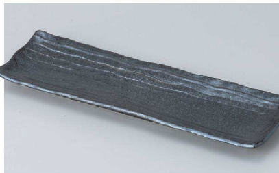
149-401-613 1,000円 木目 サンマ皿 黒 (34×10.5×2.5)