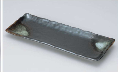
149-103-743 1,230円 うのふ吹長皿 (29.5×11.5×1.8)