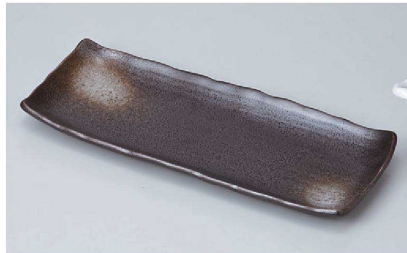
149-301-473 1,150円 チヨ コ水晶長角皿 (27.4×11×2.5)