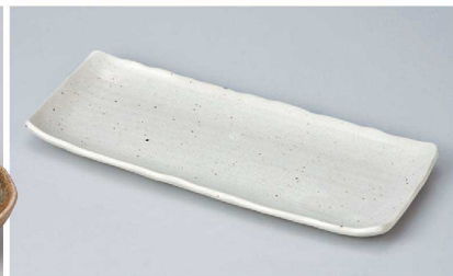
149-203-473 1,150円 小倉粉引長角皿 (27.4×11×2.5)