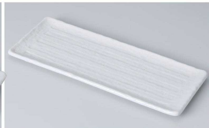
149-503-793 1,000円 白 サンマ皿 (30×11.8×1.5)