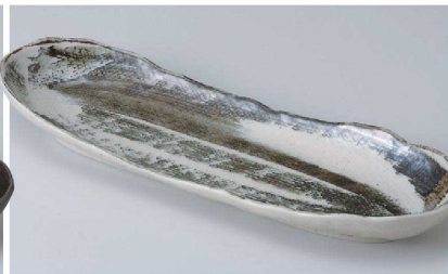
149-403-613 1,000円 舟長盛皿藍染 (33×10.4×4)