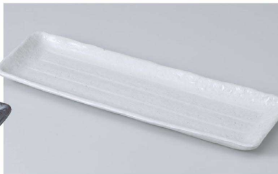
149-502-333 1,200円 粉引釉さんま皿 (33×10.5×2)