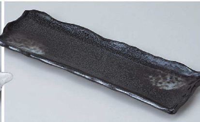
149-303-613 1,000円 天目白吹けずり長角皿 (34×11×2.7)