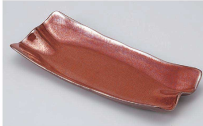
149-102-153 1,500円 波 赤長盛皿 (28×12.3×3.7)