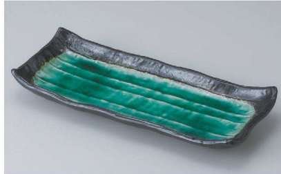
149-101-473 1,600円 深海グリーン波型さんま皿 (28.5×12.5×4)