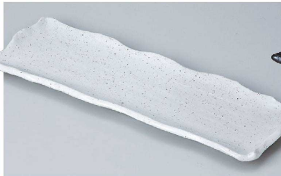
149-302-613 1,000円 粉引けずり長角皿 (34×11×2.7)