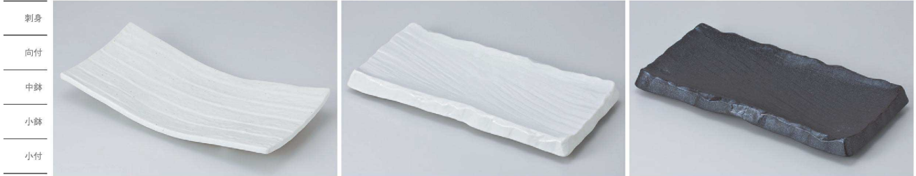
150-101-153 3,800円 粉引四足まな板皿 (31×16×4.5) 150-102-513 3,300円 白マット荒彫まな板皿 (32.3×15.9×3.7) 150-103-513 3,300円 備前黒荒彫まな板皿 (32.3×15.9×3.7)