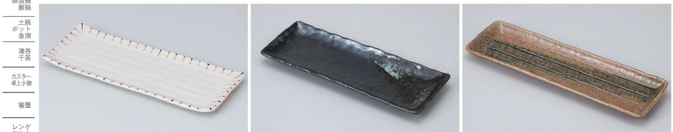
150-501-783 1,400円 二色十草 さんま皿 (30.5×12×2) 150-502-793 1,080円 軽量白吹きサンマ皿 (29.5×11.3×2.2) 150-503-403 1,050円 伊賀 長角皿 (大) (33×10×2.5)