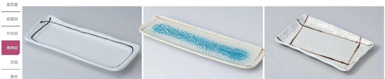
150-201-513 2,700円 黒結び石目焼物皿 (33.5×14×2.5) 150-202-263 2,500円 湧水36cm細角皿 (36.2×11.3×2.2) 150-203-703 2,500円 粉引らせん9.0長角皿 (26.5×15.9×2.5)