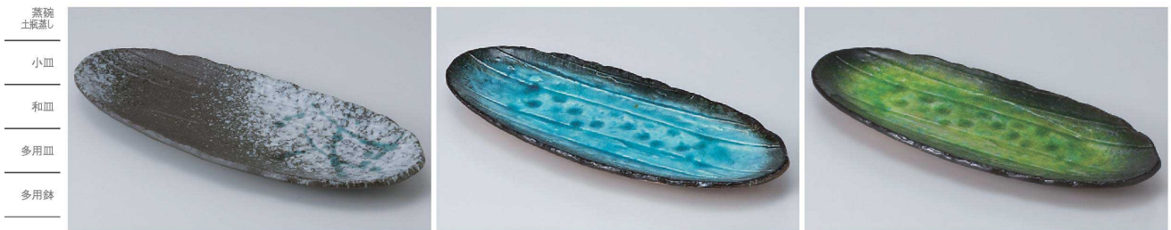
150-301-353 2,150円 土化粧手作り楕円長皿 (33×13.8×3.3) 150-302-013 1,360円 藍染スカイ楕円長皿 (33.5×13.5×3) 150-303-013 1,360円 藍染ヒワ楕円長皿 (33.5×13.5×3)