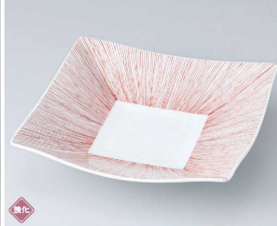
16-102-053 4,800円 千本赤十草正角6.0深皿 (18.3×18.3×4.5)