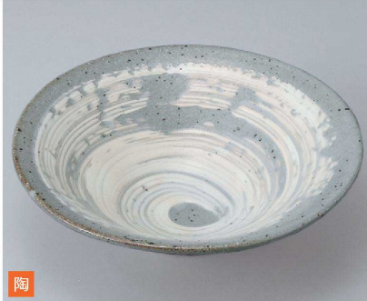
16-101-253 5,160円 粉引刷毛反向付 (18.5×5.5)