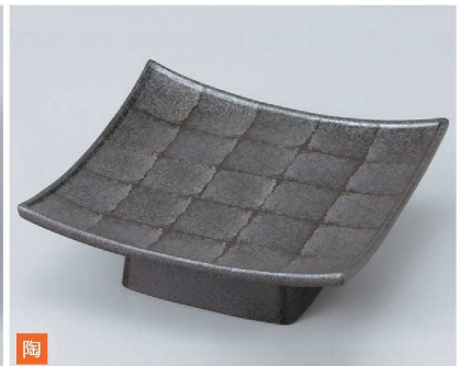
16-303-083 4,500円 炭化銀彩市松高台向付 (17×17×6)