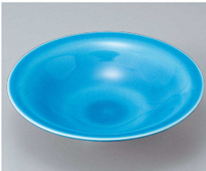
16-201-053 6,200円 足跡トルコ向付 (17.2×4.2)