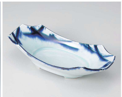
16-403-253 4,200円 青白磁手描き刷毛舟形向付 (13.5×9.3×5.5)