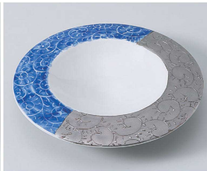
16-302-053 4,500円 プラチナ唐草向付 (18.5×3.5)