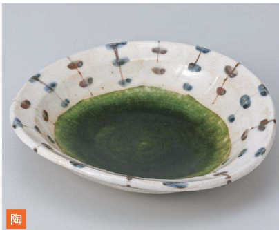
16-301-253 4,800円 手描さすだれ織部おでん皿 (19×18.5×4.3)