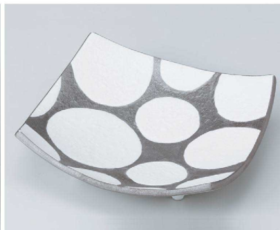
16-402-353 4,250円 銀彩水玉四方上り皿 (15.7×15.7×4.5)