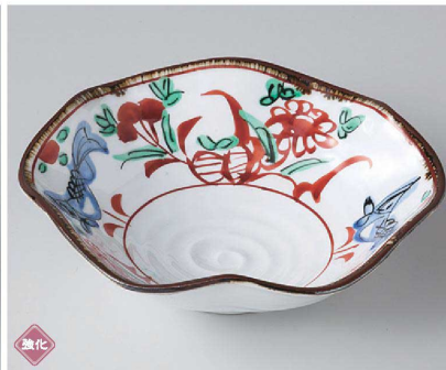
16-202-703 5,300円 赤絵魚紋向付 (17×16.2×5.2)