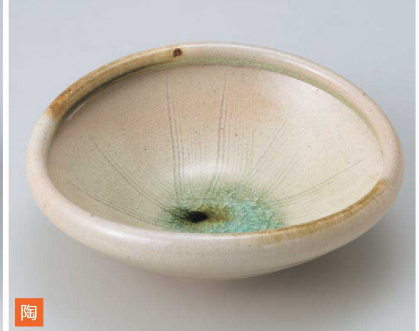
16-103-413 4,800円 灰釉鉄流 玉淵中鉢 (16×17.4×6.3)