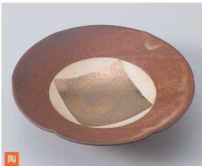
16-401-073 4,300円 窯変金彩高台皿 (16.5×5)