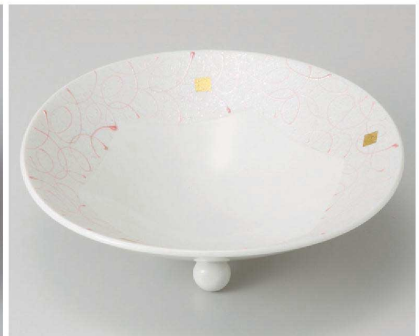
16-203-053 5,800円 乱線ピンク6.0寸向付 (18.8×6)