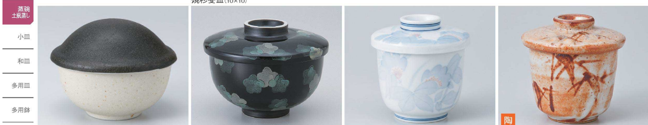
蒸碗 土製蒸し 162-301-353 2,700円 白伊賀姫蓋物 (10.7×9.5×9・180cc) 162-302-603 2,620円 花紋ちらしむし碗(大) (11×8.8・360cc) 162-303-263 2,500円 まごころむし碗 (8×9.2・250cc) 162-304-303 2,400円 赤志野竹むし碗 (7.8×9・200cc)