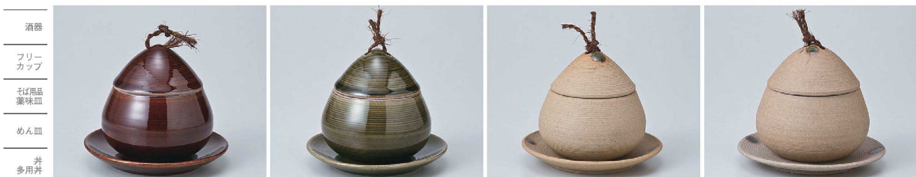
酒器 162-401-253 2,400円 アメ釉くり蒸 小 (8.5×8.8・160cc) 162-403-253 2,400円 織部くり蒸 小 (8.5×8.8・160cc) 162-405-253 2,300円 焼締くり蒸 小 (8.5×8.8・150cc) 162-407-253 2,600円 焼締くり蒸 大 (9×9・230cc)