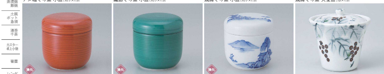
162-501-743 2,760円 赤巻夏日型むし碗 (7.5×7.8・180cc) 162-502-783 2,760円 グリーン巻夏日型むし碗 (7.5×7.8・180cc) 162-503-703 2,540円 山水夏日型むし碗 (7.7×7.7・180cc) 162-504-303 2,800円 白志野ぶどう蓋物 (9.5×9.2・190cc)