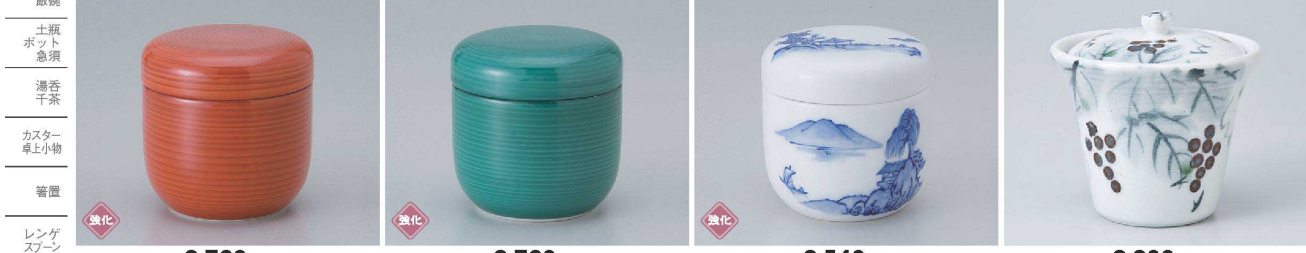
茶漬碗 飯碗 162-501-743 2,760円 赤巻夏日型むし碗 (7.5×7.8・180cc) 162-502-783 2,760円 グリーン巻夏日型むし碗 (7.5×7.8・180cc) 162-503-703 2,540円 山水夏日型むし碗 (7.7×7.7・180cc) 162-504-303 2,800円 白志野ぶどう蓋物 (9.5×9.2・190cc)