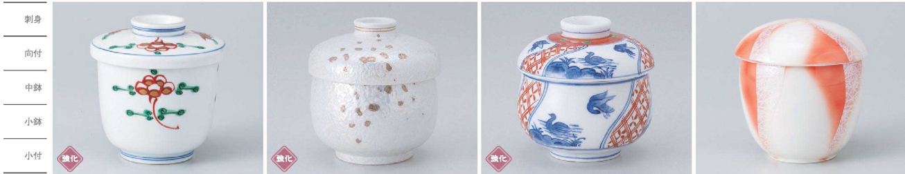
162-101-263 4,000円 錦宝来むし碗 (8×9・210cc) 162-102-743 3,850円 金吹雪むし碗 (7.8×8.6・180cc) 162-103-303 3,900円 万磨むし碗 (8.3×8.5・185cc) 162-104-353 3,750円 銀彩オレンジ吹捨りむし碗 大 (8.5×9・220cc)