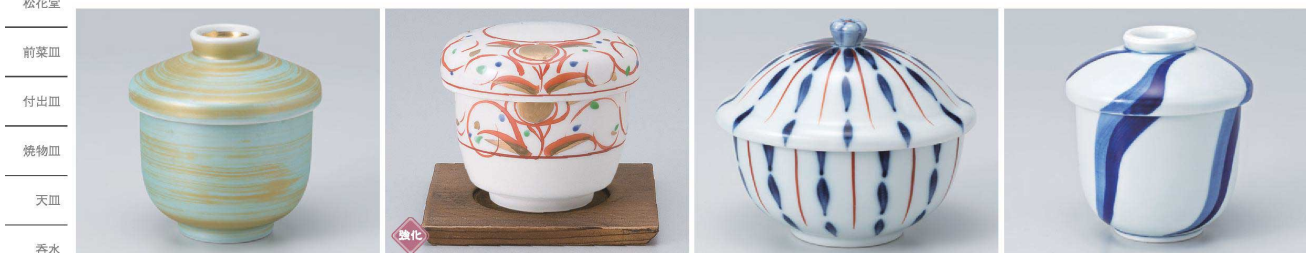
前菜皿 162-201-513 3,800円 緑巻金彩刷毛 むし碗 (7.8×8.9・215cc) 162-202-783 4,200円 赤絵華紋むし碗 (7.7×7.5・190cc) 162-203-783 370円 焼杉受皿 (10×10) 162-204-353 3,400円 花つまみ つなぎ十草姫蓋物 (10.7×9.5×9・180cc) 162-205-253 2,800円 流水長むし碗 (7.2×9.2・170cc)