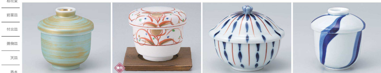
162-201-513 3,800円 緑巻金彩刷毛 むし碗 (7.8×8.9・215cc) 162-202-783 4,200円 赤絵華紋むし碗(7.7×7.5・190cc) 162-203-783 370円 焼杉受皿(10×10) 162-204-353 3,400円 花つまみ つなぎ十草姫蓋物 (10.7×9.5×9・180cc) 162-205-253 2,800円 流水長むし碗 (7.2×9.2・170cc)