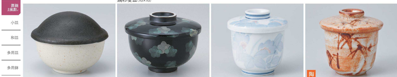
162-301-353 2,700円 白伊賀姫蓋物 (10.7×9.5×9・180cc) 162-302-603 2,620円 花紋ちらしむし碗(大) (11×8.8・360cc) 162-303-263 2,500円 まごころむし碗 (8×9.2・250cc) 162-304-303 2,400円 赤志野竹むし碗 (7.8×9・200cc)