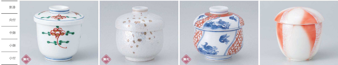
刺身 162-101-263 4,000円 錦宝来むし碗 (8×9・210cc) 162-102-743 3,850円 金吹雪むし碗 (7.8×8.6・180cc) 162-103-303 3,900円 万磨むし碗 (8.3×8.5・185cc) 162-104-353 3,750円 銀彩オレンジ吹捺りむし碗 大 (8.5×9・220cc)