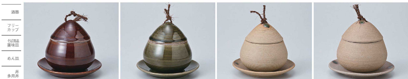
162-401-253 2,400円 アメ釉くり蒸 小(8.5×8.8・160cc) 162-403-253 2,400円 織部くり蒸 小(8.5×8.8・160cc) 162-405-253 2,300円 焼締くり蒸 小(8.5×8.8・150cc) 162-407-253 2,600円 焼締くり蒸 大(9×9・230cc) 162-402-253 1,000円 アメ釉くり蒸 小皿(10.7×1.5) 162-404-253 1,000円 織部くり蒸 小皿(10.7×1.5) 162-406-253 1,000円 焼締くり蒸 小皿(10.7×1.5) 162-408-253 1,200円 焼締くり蒸 大受皿(12×1.5)