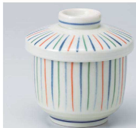
165-401-543 900円 黄地三色十草 むし碗 (8×9.2・230cc)