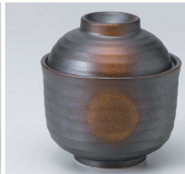
165-203-333 1,050円 南蛮金茶吹むし碗 (8.7×9・200cc)