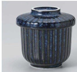
165-301-473 900円 雲海彫十草小むし碗 (7.1×8・180cc)