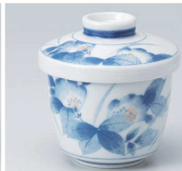
165-403-543 850円 花情 むし碗 (8×9.2・230cc)