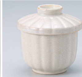
165-103-403 980円 クリーム 菊割むし碗 (9.3×10・240cc)