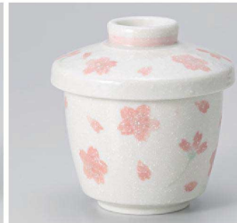
165-304-413 980円 さくらさくらむし碗 (9×8・170cc)