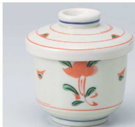
165-402-543 900円 赤花 むし碗 (8×9.2・230cc)