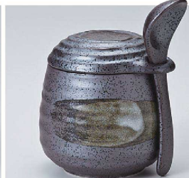
165-503-153 1,200円 白刷毛スプン付きむし碗 (8.8×9.5・280cc)