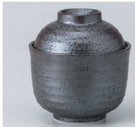
165-202-783 950円 黒釉むし碗 (8.8×9.2・200cc)