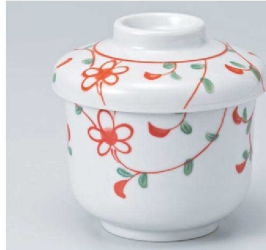
165-101-253 1,200円 赤絵小花むし碗 (9.3×9.2・220cc)