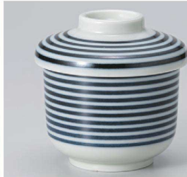
165-102-403 1,100円 せせらぎむし碗 (9.2×9.2・260cc)