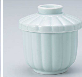
165-104-403 980円 ひわ青地 菊割むし碗 (9.3×10・240cc)