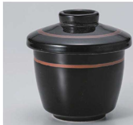
165-201-403 950円 レインボー むし碗 (8.9×9.2・230cc)