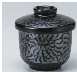
165-501-543 1,000円 黒唐草 むし碗 (8×9.2・230cc)