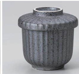
165-303-473 900円 鉄結晶彫十草小むし碗 (7.1×8・180cc)