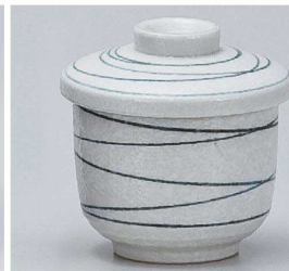
165-404-743 800円 淡雪ラインむし碗 (8×9.2・230cc)