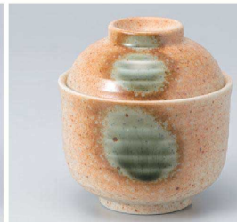
165-204-333 1,050円 伊賀織部吹むし碗 (8.7×9・200cc)