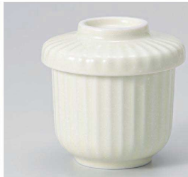
165-302-473 900円 ヒワレモン彫十草小むし碗 (7.1×8・180cc)