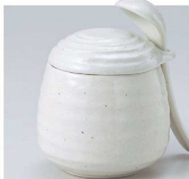
165-502-513 1,200円 粉引スプーン付 むし碗 (8.8×9.5・280cc)