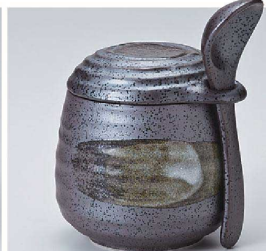
165-503-153 1,200円 白刷毛スプーン付きむし碗 (8.8×9.5・280cc)