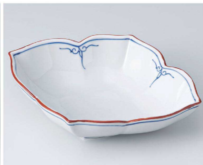
18-202-053 3,600円 染付花木甲型向付 青(19.7×15.7×4.5)