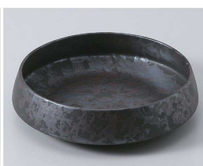
18-302-083 3,600円 瑞宝中鉢(19×17×5)