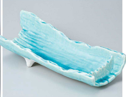
18-103-303 4,000円 マリンプルー竹割型向付(30.5×12.5×7.5)