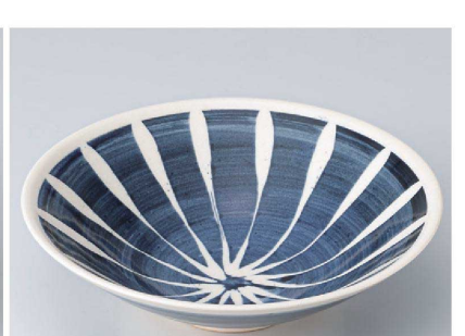
18-403-053 3,400円 藍十草20.5cm浅ボール(20.5×5.8)