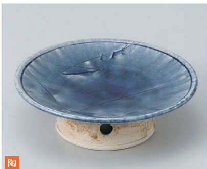
18-201-413 3,700円 呉須釉 高台5.0皿(16.5×5)