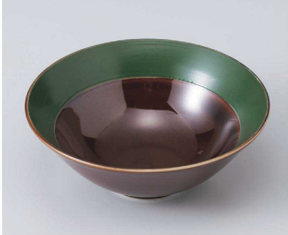
18-101-263 3,800円 obi 15.5cm鉢(15.6×6)