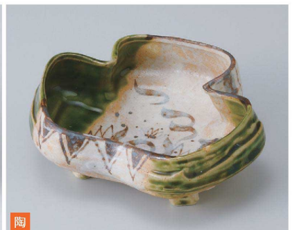
18-203-303 3,600円 割型三ツ葉織部向付(16×12.8×6)