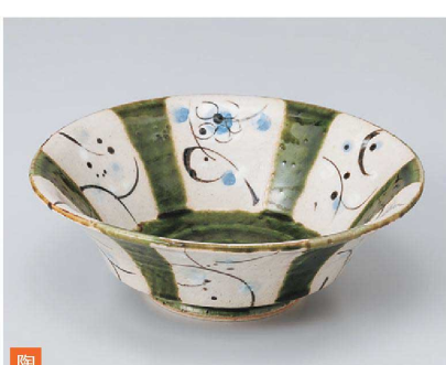
18-301-333 4,000円 織部まほろば5.0鉢(16.7×5.7)