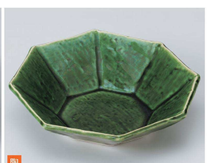
18-303-053 3,900円 織部八角鉢6.0(19.5×19.2×4.8)