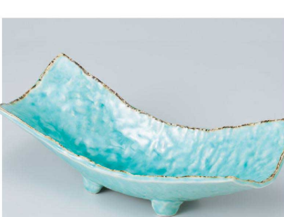
18-401-513 3,500円 刷鏤マリンプルー両上り向付(24.7×10.6×8.5)