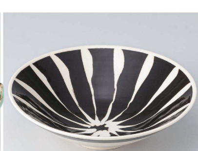
18-402-053 3,400円 黒十草20.5cm浅ボール(20.5×5.8)