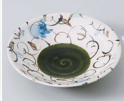
18-102-253 3,720円 織部手描き向付(17.5×4.1)