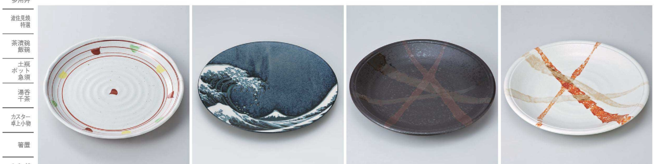
198-401-473 1,800円 粉引赤絵千鳥8.0皿(24.3x2.8) 198-403-513 5,000円 神奈川沖浪裏10吋プレート(27.5x2.5) 198-405-633 1,650円 東雲(黒)8.5皿(26.8x3.4) 198-408-633 1,650円 東雲(白)8.5皿(26.8x3.4) 198-402-473 1,400円 粉引赤絵千鳥7.0皿(21.5x2.5) 198-404-513 1,150円 神奈川沖浪裏メタ6.0皿(20x2.2) 198-406-633 900円 東雲(黒)6.5皿(19.6x2.7) 198-409-633 900円 東雲(白)6.5皿(19.6x2.7) 198-407-633 550円 東雲(黒)4.5皿(14.2x2) 198-410-633 550円 東雲(白)4.5皿(14.2x2)