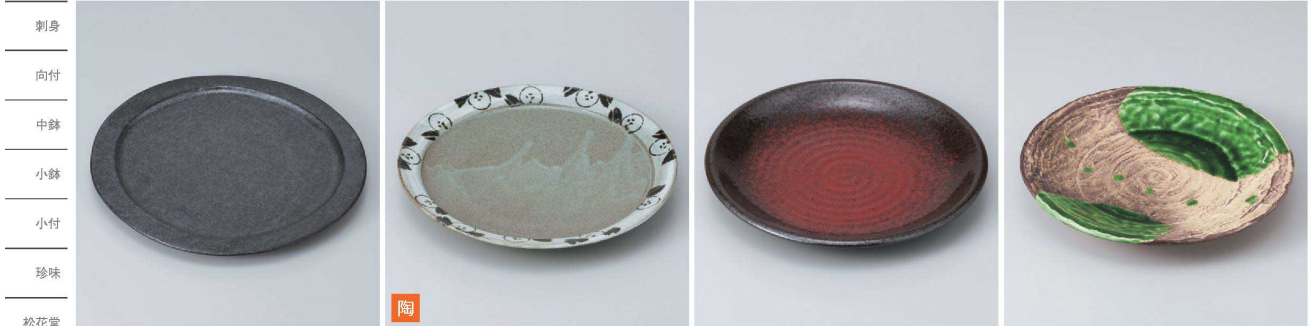
198-101-513 4,300円 銀黒丸々大皿(25.4x24.7x1.7) 198-104-783 5,300円 唐津椿8.0丸皿(24.7x3.3) 198-106-573 4,500円 朱雲9.0皿(26.5x3.3) 198-109-743 3,900円 錆軸ヒワ流8.0丸皿(24.5x3.4) 198-102-513 3,500円 銀黒丸々7寸皿(22.8x22.2x1.7) 198-105-783 2,500円 唐津椿6.0丸皿(17.8x3) 198-107-573 1,900円 朱雲7.0皿(22.5x2.9) 198-110-743 3,200円 錆軸ヒワ流6.3丸皿(19.5x2.7) 198-103-513 1,800円 銀黒丸々取皿(大)(15.4x15x2) 198-108-573 1,300円 朱雲6.0皿(17.3x2.3)