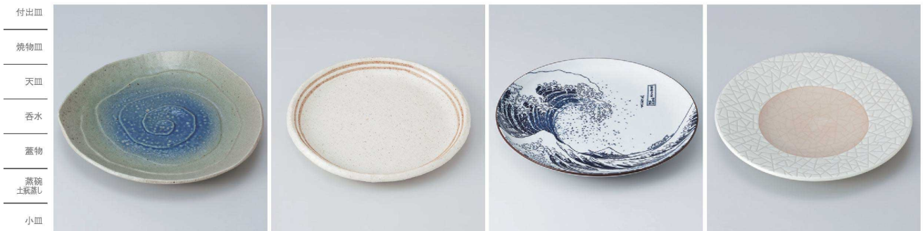
198-201-513 2,750円 コロナ三角9.0皿(27x27x3.5) 198-204-473 2,200円 クリーム粉引ライン7.0丸皿(20x2.5) 198-207-333 2,400円 北斎富士8.0皿(25.5x3) 198-209-513 1,600円 輪二重8.0寸皿(24.8x3) 198-202-513 1,350円 コロナ三角6.0皿(20x20x3) 198-205-473 1,400円 クリーム粉引ライン6.0丸皿(17x2) 198-208-333 1,320円 北斎富士7.0皿(21.6x2.9) 198-210-513 950円 輪二重6.5寸皿(19.5x2.8) 198-203-513 850円 コロナ三角5.0皿(16x16x2.5) 198-206-473 1,000円 クリーム粉引ライン丸4.0皿(12.7x1.8) 198-211-513 700円 輪二重4.8寸皿(14.5x2.5)