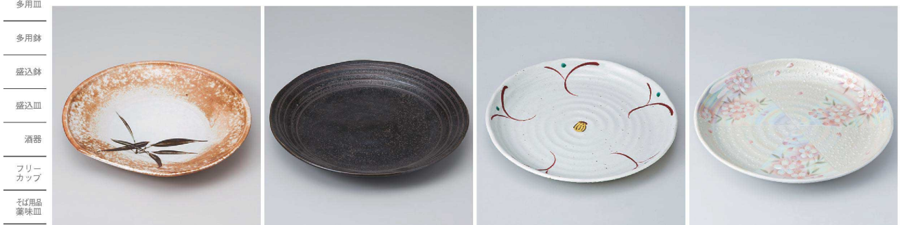
めん皿 198-301-163 1,800円 石焼青地7.5半月皿(23x3.5) 198-303-313 1,700円 黒イラボらいん8.5皿(26.5x3.5) 198-305-473 1,800円 粉引釉花だより8.0皿(24.3x3) 198-307-513 1,630円 オーロラ間取桜8.0皿(24.7x3) 井多用井 198-302-163 1,200円 石焼青地6.5半月皿(21.3x2.6) 198-304-313 1,300円 黒イラボらいん7.5皿(24x2.5) 198-306-473 1,400円 粉引釉花だより7.0皿(21.5x2.5) 198-308-513 1,200円 オーロラ間取桜7.0皿(21.6x2.5)