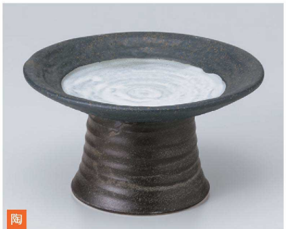
陶 20-203-263 3,400円 グレース高台向付(16.3×9)