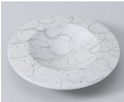
20-202-053 3,500円 ラスタリング模様向付(18.5×3.5)