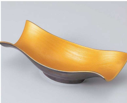
20-401-053 3,900円 アメ釉くびれ7.0向付ゴールド(21.8×9×6)