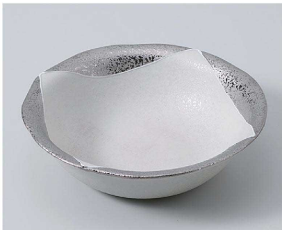
20-302-353 3,100円 プラチナスクエアアツば付丸5.5鉢(16.5×5)