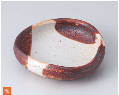
陶 20-403-053 3,000円 志野三角向付(14.5×14.5×3.5)