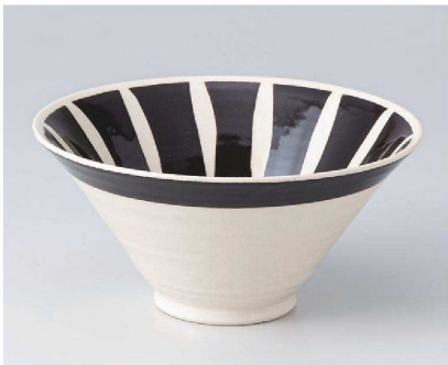
和皿 20-201-053 3,200円 黒十草反鉢向付(16.3×7.8)