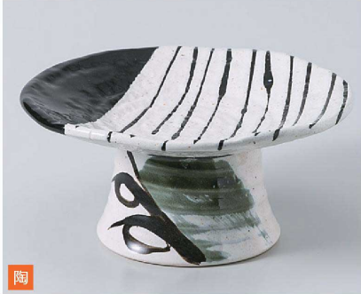
陶 20-101-563 3,650円 白黒ゼブラ特台6.0(19.4×9)