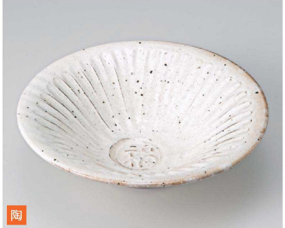
陶 20-103-073 3,250円 粉引そぎ福反向付(18.5×5.2)