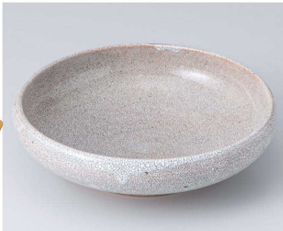
20-402-053 3,100円 錆かいらぎ漬物鉢(18×5)