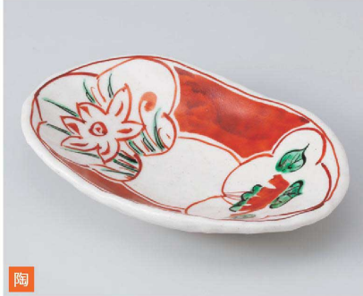
陶 20-102-303 3,300円 赤絵楕円向付(18.2×12×3.8)