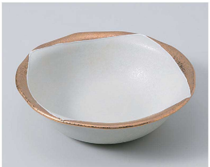
20-303-353 3,100円 ゴールドスクエアアツば付丸5.5鉢(16.5×5)