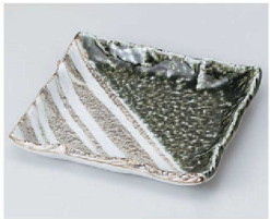
201-203-703 1,340円 織部ストライプ5.0正角皿 (14.5×14.5×2.5)