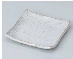
201-201-743 1,400円 白樺角銘々皿 (13.3×13.3×2.3)