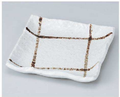
201-204-703 1,200円 粉引らせん5.0正角皿 (14.5×14.5×2.5)