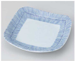
201-605-403 430円 京十草 銘々皿 (14×14×2.5)