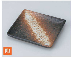
201-501-703 680円 黒備前銘々皿 (12×12×1.7)