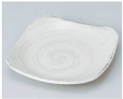
201-604-403 430円 新粉引銘々皿 (14×14×2.5)