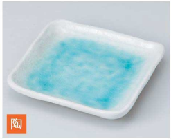
201-503-793 770円 白流水正角中皿 (14×14×2.2)