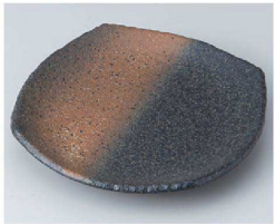
201-403-063 850円 黒備前5.0皿 (16.2×2.3)