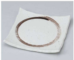
201-304-153 1,100円 わ角ちぎり皿(白) (14.5×14.3×2.2)