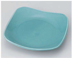
201-603-403 520円 青白磁 銘々皿 (14×14×2.5)