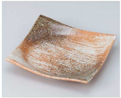
201-504-633 560円 信濃路正角銘々皿 (13.5×13.5×2)