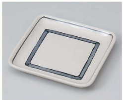
201-302-793 1,050円 布目帯ライン中型銘々皿 (13.2×13.2×1.9)