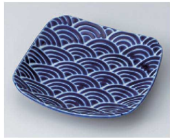
201-601-053 490円 瑠璃小紋正角5.0皿 波 (14×14×2.4)