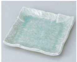
201-202-793 1,320円 青地角皿 (15×15×2)