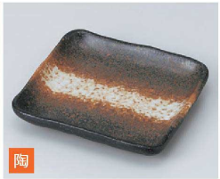
201-405-563 760円 黒備前正角中皿 (13.5×2.3)