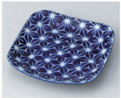
201-602-053 490円 瑠璃小紋正角5.0皿 麻 (14×14×2.4)