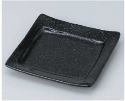
201-103-523 1,870円 鉄油天目角取皿 (14×13.5×1.7)