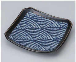
201-505-243 600円 青海波正角4.5皿 (13.5×13.5×2.5)