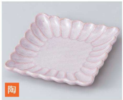
201-205-513 1,000円 ピンクうのふ菊華角取皿 (15.1×2.6)