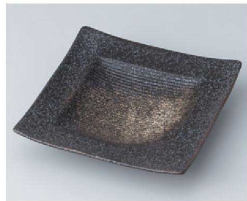
201-301-153 1,200円 黒千段角皿(小) (15×15×3.1)