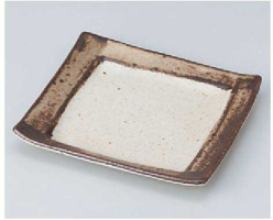
201-102-523 1,870円 うのふ回角銘々皿 (14×13.5×2)