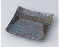
201-104-563 1,450円 山がすみ 石目4.3正角皿 (12.5×2.9)