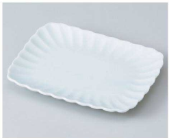
201-303-603 1,240円 青磁菊型 長角取り皿 (14.5×11×2)