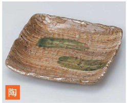
201-402-513 850円 黄瀬戸四角とり皿 (15.6×15.6×2)