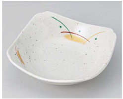
201-502-703 730円 赤絵むさしの5.0角皿 (14×14×4)