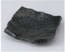
201-105-513 1,250円 黒吹き角皿 (13.4×13.4×2)