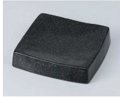
201-101-513 2,850円 油滴天目スクエア(小) (128×3)