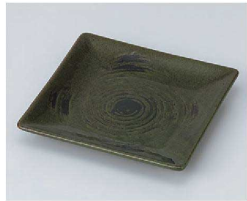
201-401-603 940円 織部かすり13cm正角皿 (13.4×13.4×1.8)