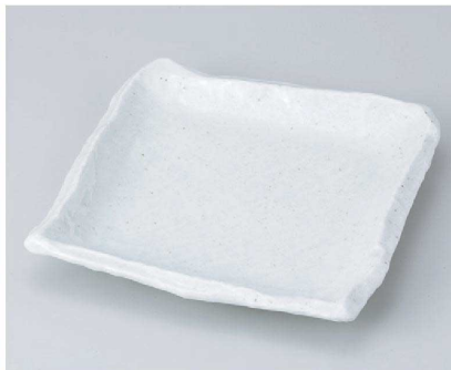
205-302-263 5,000円 白釉23cm正角皿 (23×3.5) 205-303-263 2,850円 白釉19cm正角皿 (19×3.5)