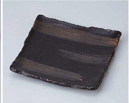
205-103-253 4,500円 加茂川123cm正角皿 (23×23×3)