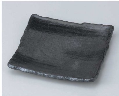
205-401-253 4,500円 大和扇23cm正角皿 (24×23.5×3.5) 205-402-253 2,800円 大和扇19cm正角皿 (19.5×19×2.5)