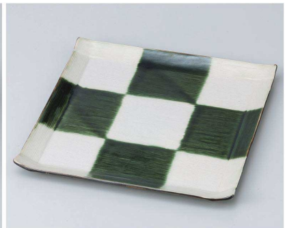
205-304-473 3,300円 織部市松コヨリ大皿 (24.5×24.5×2) 205-305-473 2,000円 織部市松コヨリ正角皿 (16.3×16.3×2.2)