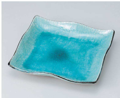
205-202-353 3,000円 清流9.0正角皿 (23×23×4.5)