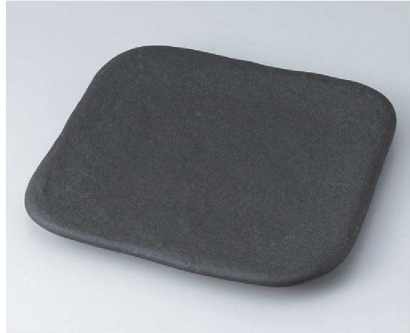
205-101-083 4,500円 黒伊賀25cm正角皿 (24.8×24.8×2.4)