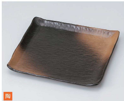
205-201-513 3,100円 黒備前櫛目正角皿 (607002) (24×24×2.5)