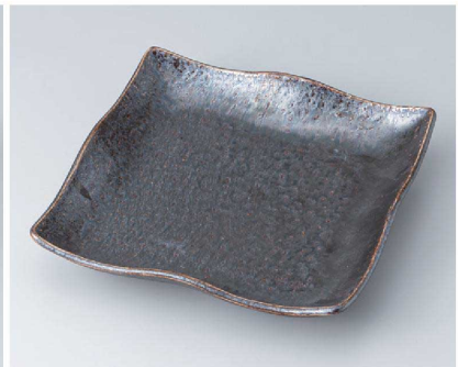
205-203-253 2,850円 23cm正角皿いぶし銀結晶 (23.4×23.4×4.5)