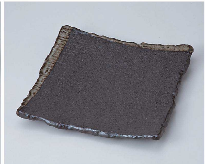
205-405-513 5,000円 柳ヶ瀬凜23cm正角皿 (23.3×23.3×3) 205-406-513 2,900円 柳ヶ瀬凜19cm正角皿 (19.5×2.4)