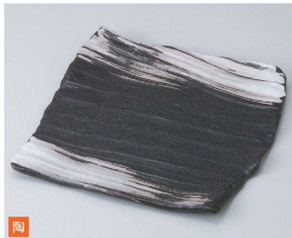
205-301-843 3,300円 白刷毛目8.0正角盛皿 (24.5×24×3)