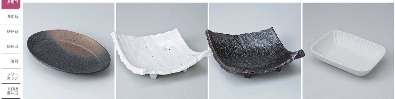
多用皿 206-301-063 2,000円 黒備前23cm長丸皿 (23.3×15.2×2.8) 206-302-783 2,400円 白釉四つ足変型盛皿 (26.8×17.5×7) 206-303-783 2,400円 黒釉四つ足変型盛皿 (26.8×17.5×7) 206-304-153 1,600円 白しのぎ長角深鉢 (19.6×15.5×4.5)