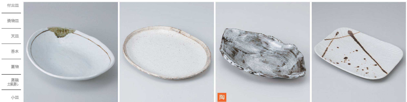
前菜皿 206-201-793 2,340円 志野茶ライン小判鉢(大) (25×19.3×5.8) 206-203-253 2,800円 白唐津小判皿大 (26.2×22.2×2.5) 206-205-513 2,000円 カイラギ(黒)ちぎり角中鉢 (23.5×14.5×3.5) 206-206-353 2,700円 金色流し盛皿 (25.8×19.8×3) 付出血 206-202-793 1,740円 志野茶ライン小判鉢(小) (21.8×16.4×5) 206-204-253 1,800円 白唐津小判皿中 (21.5×17.5×1.7)