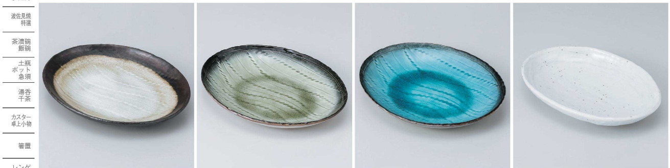
めん皿 206-401-153 1,800円 縄目楕円皿 窯変金彩 (24×19.5×2.5) 206-402-013 1,360円 均窯グリーン縄目楕円皿 (24×19.5×2.5) 206-403-013 1,360円 均窯スカイ縄目楕円皿 (24×19.5×2.5) 206-404-253 1,950円 錆ウズ22cm楕円皿 (22×16.5×4)