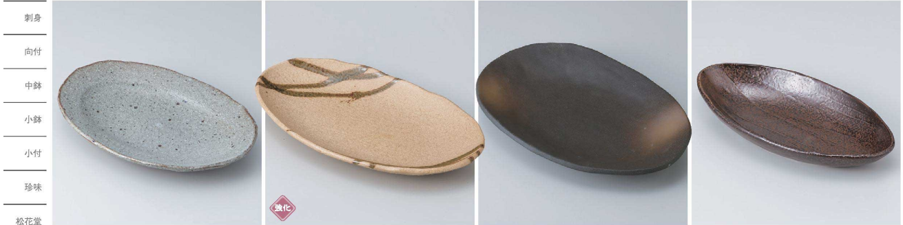
刺身 206-101-083 4,200円 砂唐津25cm楕円皿 (25.2×16.8×3.8) 206-102-783 4,000円 伊賀織部筋10.0多用皿 (30×17.2×3.5) 206-103-253 3,840円 備前マルチプレート(大) (27.2×18.1×3.4) 206-104-633 1,800円 茶南蛮24.5cm舟型鉢 (24.5×13×3.8)