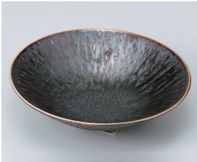
22-301-053 3,300円 孔雀釉とちり平鉢(小) (17.2×4.8)