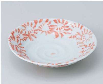
22-401-263 2,650円 手造り唐草赤平鉢 (15.5×4)