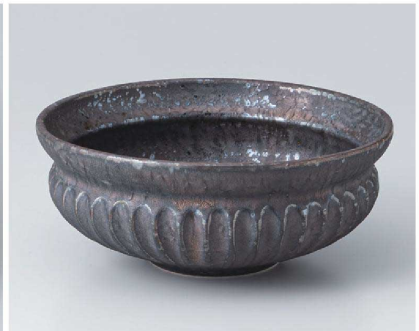
22-403-053 2,600円 金結晶しのぎ彫5.0鉢 (15.2×6.3)