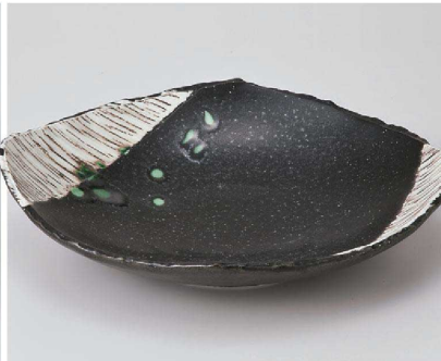
22-302-353 2,650円 黒織部角櫛目型5.5平鉢 (21.5×18×5)