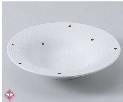
22-202-703 2,940円 淡雪向付 (18×4)