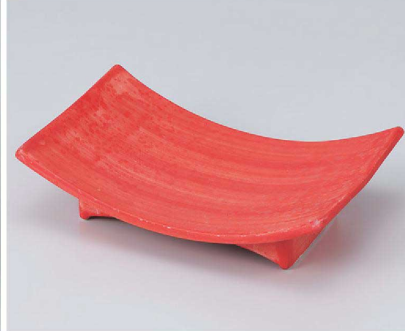
22-102-053 3,500円 ローズ赤弓型高台向付 (16.5×11.5×4.5)