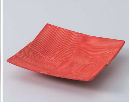
22-103-303 3,100円 ローズ赤 市松正角5.0皿 (15.5×15.5×5.7)