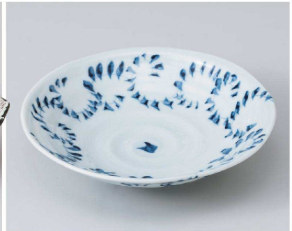
22-303-263 2,650円 手造り唐草青平鉢 (15.5×4)