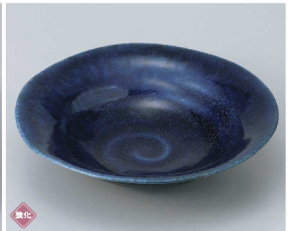
22-203-703 3,000円 紺勾玉平鉢 (19.3×5.4)