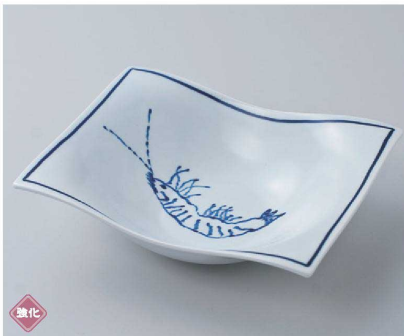
22-201-743 2,770円 海老画四方形向付 (16.2×12.3×4.5)