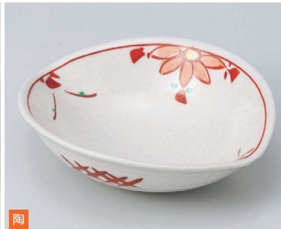
22-402-743 2,620円 赤絵花つなぎずげ傘向付 (17.3×15×5.3)