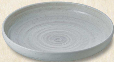
220-301-543 8,800円 東風石目10.0盛鉢(31.5×6)