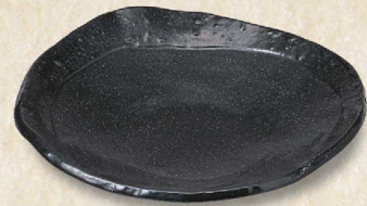
220-303-543 5,400円 黒粒大盛皿(28×6)