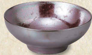
220-203-513 8,500円 紅彩25cm深大鉢(25.3×10)