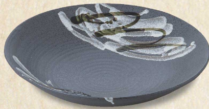
220-101-513 20,000円 鉄黒乱線紋尺2大鉢(38×8.6)