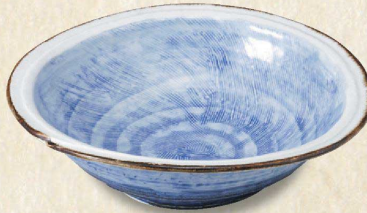
220-102-053 16,000円 呉須くし目たわみ大鉢(35.2×33.2×9.3)