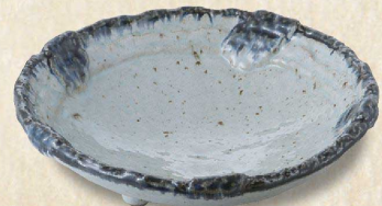
220-103-053 11,500円 かいらぎ縄漉9.5盛鉢(29×8)