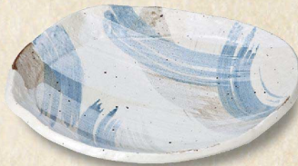
220-302-543 5,600円 さざれ大盛皿(28×6)