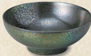
220-202-513 8,500円 黒彩25cm深大鉢(25.3×10)