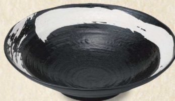
221-504-573 11,050円 黒海流10.0盛鉢(30.7×8.6) 221-505-573 7,000円 黒海流9.0盛鉢(27×7.2) 221-506-573 5,600円 黒海流8.0盛鉢(25×7.3)