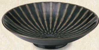
221-401-263 2,800円 竹林織部28cm高台盛鉢(28.3×7.3)