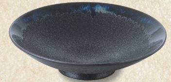
221-403-633 2,500円 緑彩流し9.0盛鉢(28.5×7.5)