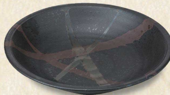
221-302-263 3,000円 燐き黒盛皿(28.7×6)