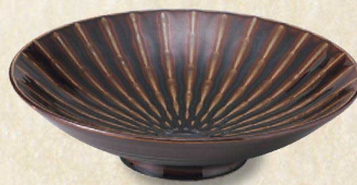
221-402-263 2,800円 竹林ア×28cm高台盛鉢(28.3×7.3)