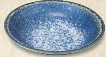
221-105-263 3,300円 すぶらっしゅ巧み29cm盛皿(29×6.3) 221-106-263 1,300円 すぶらっしゅ巧み23cm盛皿(23×4.8)