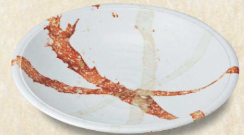
221-303-253 2,800円 東雲9.5寸盛皿(29×6.1)