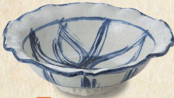
陶 221-201-303 12,000円 手造り安南10.0盛鉢(30.5×12)