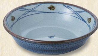
221-202-253 7,000円 呉須巻錆点9.0鉢(28×8.2)