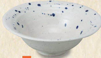
陶 221-103-313 4,850円 コス散し9.0反井(27.8×9.5) 221-104-313 3,700円 コス散し8.0反井(24.6×8.6)