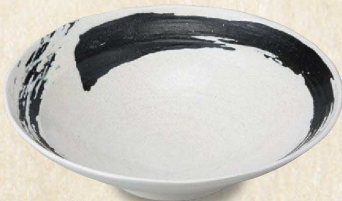
221-501-573 11,050円 白海流10.0盛鉢(30.7×8.6) 221-502-573 7,000円 白海流9.0盛鉢(27×7.2) 221-503-573 5,600円 白海流8.0盛鉢(25×7.3)