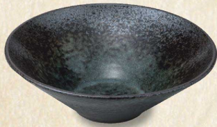
221-101-263 8,100円 南蛮反9.0盛鉢(26.8×9) 221-102-263 6,800円 南蛮反8.0盛鉢(25×8.4)