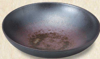
221-301-243 3,700円 AYA緋色9.5盛鉢(28.5×7.7)