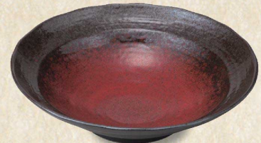
221-507-573 11,050円 朱雲10.0盛鉢(30.7×8.6) 221-508-573 7,000円 朱雲9.0盛鉢(27×7.2) 221-509-573 5,600円 朱雲8.0盛鉢(25×7.3)