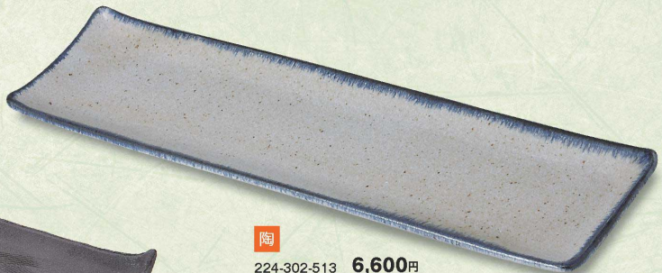
陶 224-302-513 6,600円 灰釉コス長皿(小) (52.5×14.3×2.4)