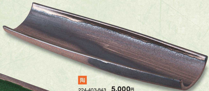
陶 224-403-843 5,000円 金彩(手造)長皿 (42.5×12×2.5)