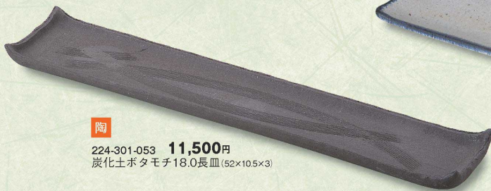
陶 224-301-053 11,500円 炭化土ボタモチ18.0長皿 (52×10.5×3)