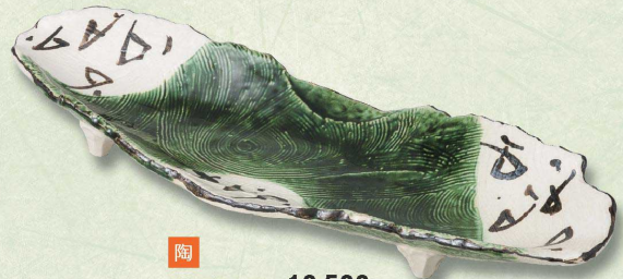
陶 224-202-263 10,500円 織部長盛皿 (43×14.7×5)