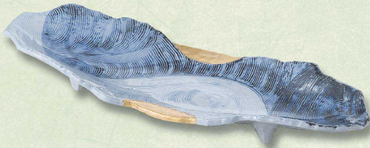
224-201-353 11,000円 金彩呉須櫛目長皿 (42.8×14.5×5.5)