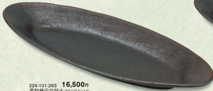
224-101-263 16,500円 黒釉楕円皿特大 (60×20.6×4.8)