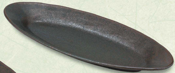
224-102-263 11,000円 黒釉楕円皿大 (43×17.5×3.5)